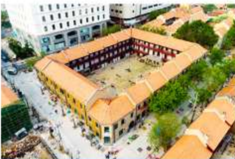
เมืองเก่าเยอรมัน ตรอกกว่างซิวหลี่