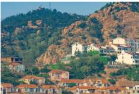
หมู่บ้านชาจื่อโข่ว

จากนั้นนำท่าน เดินทางสู่ คาเฟ่อีสต 落日古堡 นำท่านชมปราสาทในเทพนิยาย ที่ตั้งตระหง่านอยู่ริมชายหาด นานาชาติเวทย์ให้ คาเฟ่ที่ออกแบบด้วยสถาปัตยกรรมสไตลยุโรป ตัดกับวิวทะเลสีคราม และที่นี่คือแม่เหล็กดึงดูดนักท่องเที่ยวมาเก็บบรรยากาศความสวยงามความโรแมนติก (ตัวปราสาทเป็นร้านกาแฟ หากท่านต้องการเข้าไปด้านใน ต้องจ่ายค่าเครื่องดื่ม ตามเมนูของทางร้าน ซึ่งไม่รวมในอัตราค่าทัวร์)