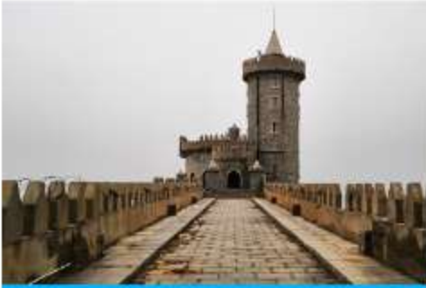
คาเฟ่อีสต