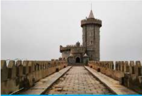
คาเฟ่อีสต