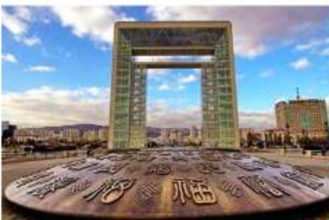
ประตูแห่งโชคกลาง