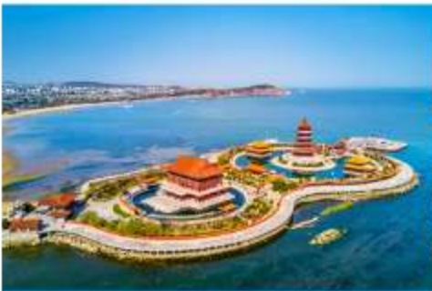
อุทยานท่องเที่ยวแปดเซียนข้ามทะเล