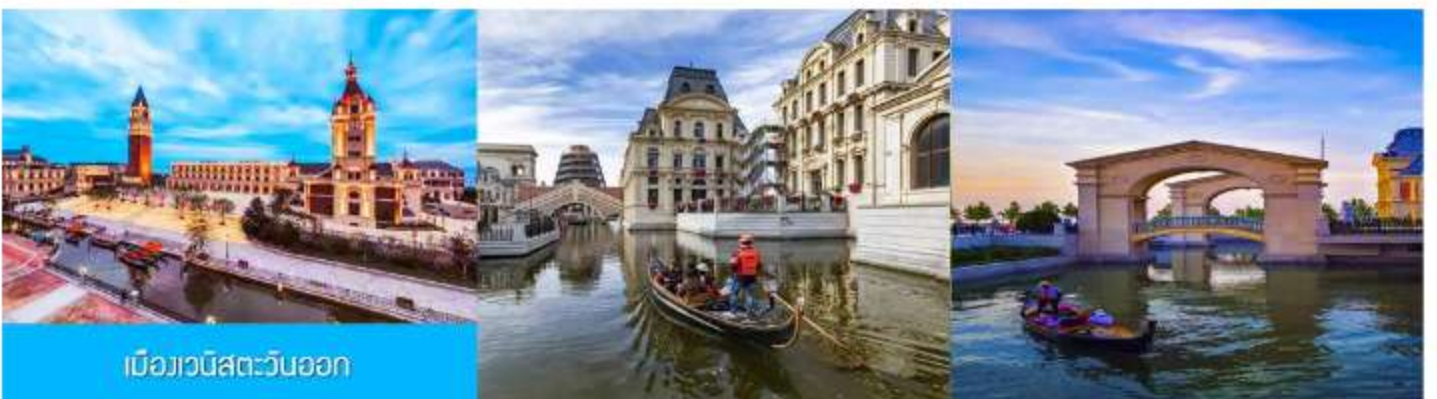
เมืองวนิสตะวันออก