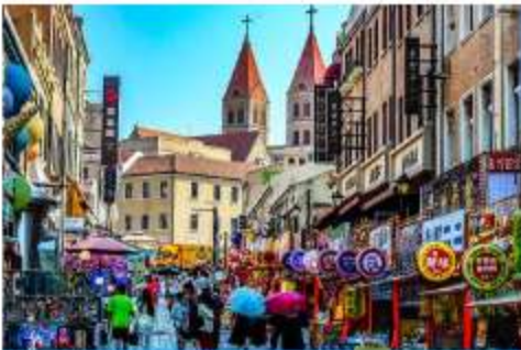
ถนนนางซาบ