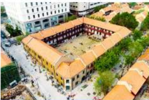
เมืองเก่าเยอรมัน ทรอกกว่างซิวหลี่