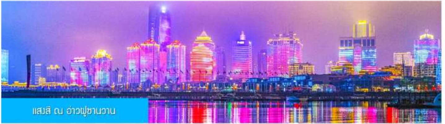
แสงสี ณ อ่าวฟูซานวาน

หลังอาหารนำท่านชมความอลังการของแสงสี ณ อ่าวฟูซานวาน 浮山湾灯光秀 ชมความอลังการของแสงสียามหัวค่ำ และไฟที่เด่นระบ่ำได้บนตึกสูง และเป็นหนึ่งในไนท์วิวที่สวยงามที่สุดแห่งหนึ่งของจีน..... พักที่ JIFENG HOTEL / KAILAIZHIHUI HOTEL โรงแรมระดับ 4 ดาวท้องถิ่น เมืองชิงเต่า