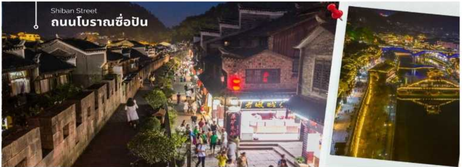
Shibian Street ถนนโบราณชื้อปิ่น

นำท่านเดินทางโดยรถโค้ชปรับอากาศเข้าสู่ เมืองโบราณเฟิ่งหวง (เมืองหงส์) ใช้เวลาเดินทางประมาณ 3 ชั่วโมง เดินถนนโบราณ Feng Hueng Ancient Town ที่ถนนชื้อปิ่น Shibian Street เมืองที่ยังคงรักษาเอกลักษณ์ความเป็นพื้นเมืองผสมผสานกับยุคปัจจุบันเอาไว้ได้อย่างลงตัววิถีชีวิตของชาวบ้านที่อาศัยอยู่ที่นี่ บรรยากาศในเมืองเฟิ่งหวง ถนนเก่าชื้อปิ่นเป็นถนนปูหินแคบๆ กว้างไม่ถึง 5 เมตร ทอดยาวจากทางเข้าวัดเต้าเหมินไปทางทิศตะวันตก ผ่านถนนหลายสาย ได้แก่ ถนนนครอส ถนนเจิ้งตะวันออก ถนนเจิ้งตะวันตก ศาลาขุยหลง หียงเซียวซง เต้าซานลา ศาลาเจียกั๋ว และสุสานเจินฉงเหวิน สุดท้ายจะนำไปสู่ “น้ำพุแรกใต้ฟ้า” ถนนสายนี้มีความยาวกว่า 3,000 เมตร และเป็นย่านการค้าที่คึกคักที่สุดในเฟิ่งหวง