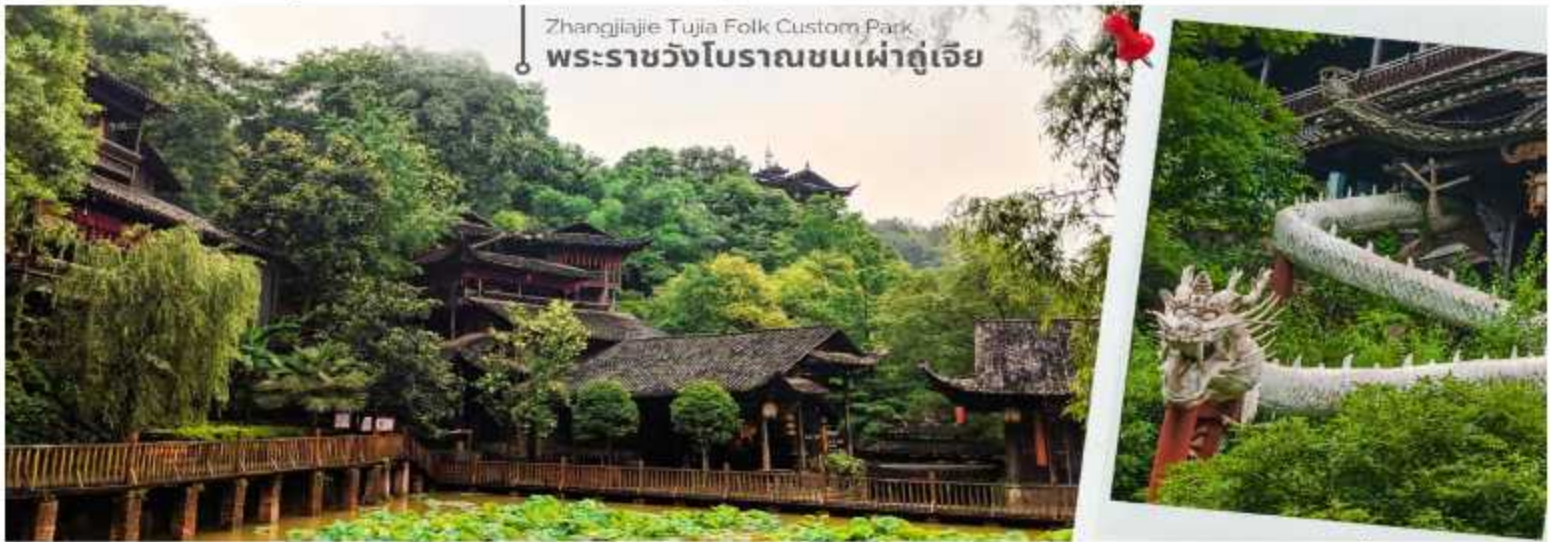
Zhangjiajie Tujia Folk Custom Park พระราชวังโบราณชนเผ่าตู่เจีย

นำทุกท่านเดินทางสู่ พระราชวังโบราณของชนเผ่าตู่เจีย เป็นสถานที่ท่องเที่ยวที่สำคัญในเมืองจางเจียเจีย ประเทศจีน ซึ่งเป็นที่อยู่อาศัยของชนเผ่าตู่เจีย. ภายในพระราชวังมีการแสดงวิถีชีวิต พิธีกรรม และวัฒนธรรมของชนเผ่าตู่เจีย. นอกจากนี้ยังมีอาคาร 9 ชั้นที่สร้างจากไม้ ซึ่งเป็นที่พำนักของเจ้าเมืองในอดีต ซึ่งปัจจุบัน สามารถขึ้นไปชมได้ แต่ละชั้นจะมีแสดงเสื้อผ้าของใช้ของฮ่องเต้ รวมถึงของพื้นเมืองให้เราได้ดู ด้านบนสุดเห็นวิวเมืองด้วย สวยงาม และด้านหลังยังมีอาหารใหม่ที่สร้างหลังอาคารใหญ่ๆ จะมี 2 อาคาร มีบ่อน้ำตามีหลักขวงจี้