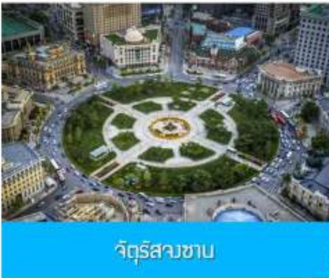
จัตุรัสวงเวียน