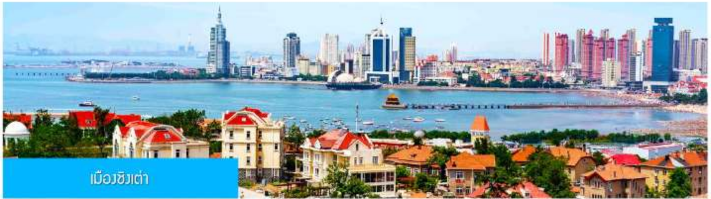
เมืองชิงเต่า