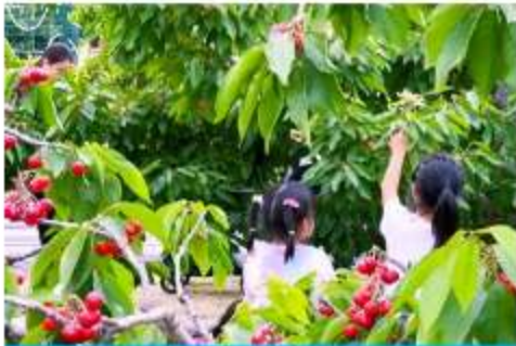
สวนเชอร์รี่

รับประทานอาหารเช้า ณ ห้องอาหารของโรงแรม (10)