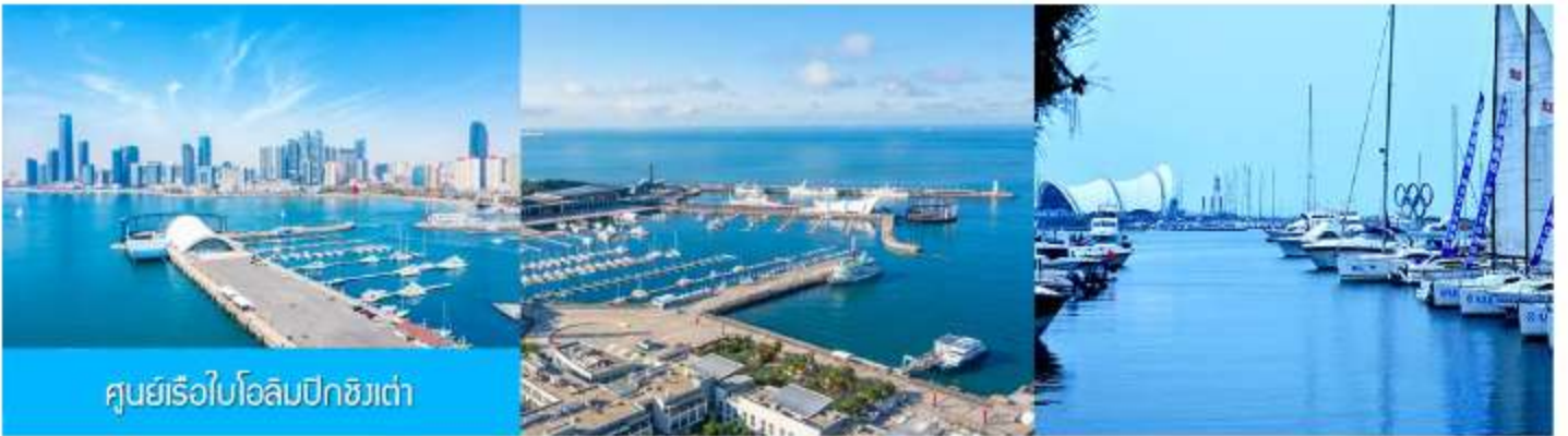
ศูนย์เรือใบโอลิมปิกชิงเต่า

จากนั้นนำท่านเที่ยวชม โรงเบียร์ชิงเต่า 青岛啤酒博物馆 พิพิธภัณฑ์เบียร์ที่ขึ้นชื่อของเมืองชิงเต่า ซึ่งเป็นเบียร์ยี่ห้อแรกที่ผลิตขึ้นในประเทศจีน ชมเบียร์ คอลเลกชันที่มียี่ห้อหลากหลายที่สุดของโลก และชมการจัดแสดงภาพและวิดิทัศน์เกี่ยวกับวิวัฒนาการของเบียร์ ขั้นตอนการผลิตและอื่น ๆ ที่เกี่ยวข้อง พร้อมชิมเบียร์ชิงเต่า ซึ่งเป็นเบียร์ที่ขายดีที่สุดในยี่ห้อหนึ่งของจีน.. (ชิมเบียร์ชิงเต่าท่านละ 1 แก้ว รับประทานอีก 1 ขวดเล็ก ตอนเดินออก)