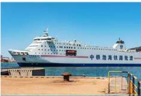
เรือ ZHONGTIE BOHAI CRUISE