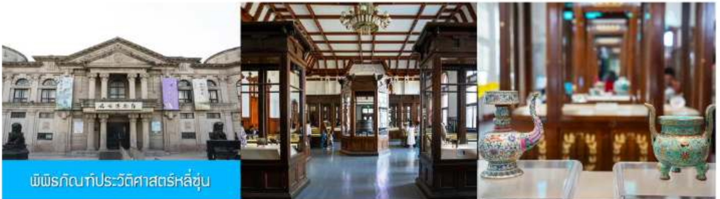
พิพิธภัณฑ์ประวัติศาสตร์หลี่ซุ่น

นำท่านเที่ยวชมและเก็บภาพ ณ สถานีรถไฟหลี่ซุ่น 旅顺火车站 เป็นสถานีปลายทางของเส้นทางรถไฟสาขา เส้นหยาง - ต้าเหลียน สร้างขึ้นในปีค.ศ. 1903 ออกแบบโดยสถาปนิกชาวรัสเซีย เป็นอาคารอิฐก่อปูนผสม โครงสร้างไม้ตามสถาปัตยกรรมรัสเซีย.