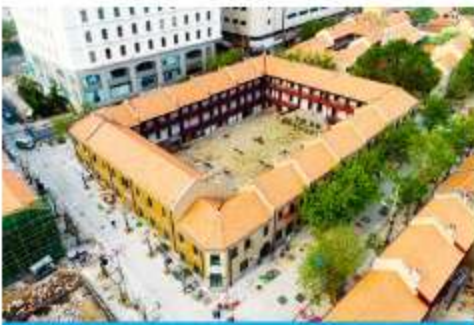
เมืองเก่าเยอรมัน ตรอกกว้างชิงหลี

จากนั้นนำท่านเดินเที่ยวชม ถนนวงซัน 中山路 ถนนที่เต็มไปด้วยกลิ่นอายยุโรป และถนนสายนี้มีบ้านที่กึ่งเรื่องราวมากกว่าศตวรรษของเมืองชิงเต่าไว้ ที่นี่เป็นศูนย์กลางการค้าแห่งแรกที่เต็มไปด้วยสถาปัตยกรรมสไตล์ยุโรปเก่าแก่ที่ได้รับอิทธิพลมาจากเยอรมัน ให้ท่านได้เดินเก็บบรรยากาศ และ เก็บภาพกับโบสถ์เซนต์ไมเกิ้ล (ชมด้านนอก) โบสถ์แห่งนี้ที่คู่รักนิยมมาถ่ายภาพงานแต่งงานกันมากที่สุดในเมืองชิงเต่า ให้ท่านถ่ายรูปเก็บภาพ