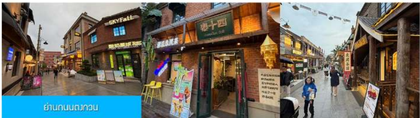
ย่านถนนตงกวน

นำท่านเที่ยวชม จัตุรัส星海 星海广场 เป็นจัตุรัสขนาดใหญ่เป็นแลนด์มาร์คสำคัญของเมืองต้าเหลียน สร้างขึ้นเพื่อเฉลิมฉลองในโอกาสที่รัฐบาลอังกฤษคืนเกาะฮ่องกงโนให้จีนในปี ค.ศ. 1997 ตั้งอยู่ชายฝั่งทะเลในเมืองต้าเหลียน เป็นจัตุรัสใจกลางเมืองที่ใหญ่ที่สุดในโลกและเป็นแลนด์มาร์คของเมืองต้าเหลียน รายล้อมด้วยตึกระฟ้าที่ทันสมัย ภายในมีบ่อน้ำพุดนตรี ลานหญ้าขนาดใหญ่ และลานกว้างสำหรับจัดกิจกรรมกลางแจ้ง อาทิ เทศกาลเบียร์นานาชาติ การแข่งขันวิ่งมาราธอน งานแฟชั่นนานาชาติเมืองต้าเหลียน ฯลฯ