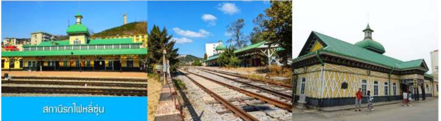
สถานีรถไฟหลี่ซุ่น

05.00 น. เช้า เรือท่องเที่ยวนำคณะเดินทางถึงท่าเรือเมืองต้าเหลียน นำท่านขึ้นรถบัสเพื่อเดินทางสู่ตัวเมืองต้าเหลียน รับประทานอาหารเช้า ณ ห้องอาหาร (7)