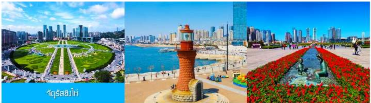
จัตุรัส星海

นำท่านเที่ยวชม จัตุรัส星海 星海广场 เป็นจัตุรัสขนาดใหญ่เป็นแลนด์มาร์คสำคัญของเมืองต้าเหลียน สร้างขึ้นเพื่อเฉลิมฉลองในโอกาสที่รัฐบาลอังกฤษคืนเกาะฮ่องกงโนให้จีนในปี ค.ศ. 1997 ตั้งอยู่ชายฝั่งทะเลในเมืองต้าเหลียน เป็นจัตุรัสใจกลางเมืองที่ใหญ่ที่สุดในโลกและเป็นแลนด์มาร์คของเมืองต้าเหลียน รายล้อมด้วยตึกระฟ้าที่ทันสมัย ภายในมีบ่อน้ำพุดนตรี ลานหญ้าขนาดใหญ่ และลานกว้างสำหรับจัดกิจกรรมกลางแจ้ง อาทิ เทศกาลเบียร์นานาชาติ การแข่งขันวิ่งมาราธอน งานแฟชั่นนานาชาติเมืองต้าเหลียน ฯลฯ