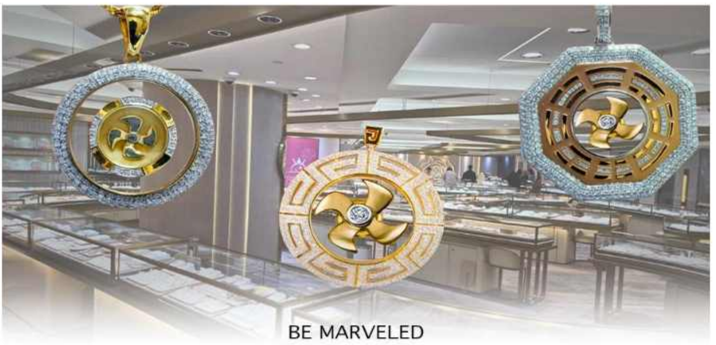
BE MARVELED โรจนาจิวเวลรี่ & หยก

นำท่านชม ศูนย์ดวงจู้ยี้ กังหันเศรษฐี ที่ขึ้นชื่อของฮ่องกง ท่านจะได้พบกับงานดีไซน์ที่ได้รับรางวัลยอดเยี่ยม และใช้ใน การเสริมดวงเรื่องดวงจู้ยี้ ศูนย์ดวงจู้ยี้กังหันเศรษฐี วัดแชกง" ไม่ใช่ชื่อวัดโดยตรง แต่เป็นชื่อที่เกี่ยวข้องกับ วัดแชกงหมิว (Che Kung Temple) ในฮ่องกง ซึ่งเป็นที่รู้จักกันดีในเรื่อง กังหันนำโชค ที่เชื่อว่าสามารถหมุนปัดเป่าสิ่งชั่วร้ายและนำโชคลาภเข้ามาในชีวิต