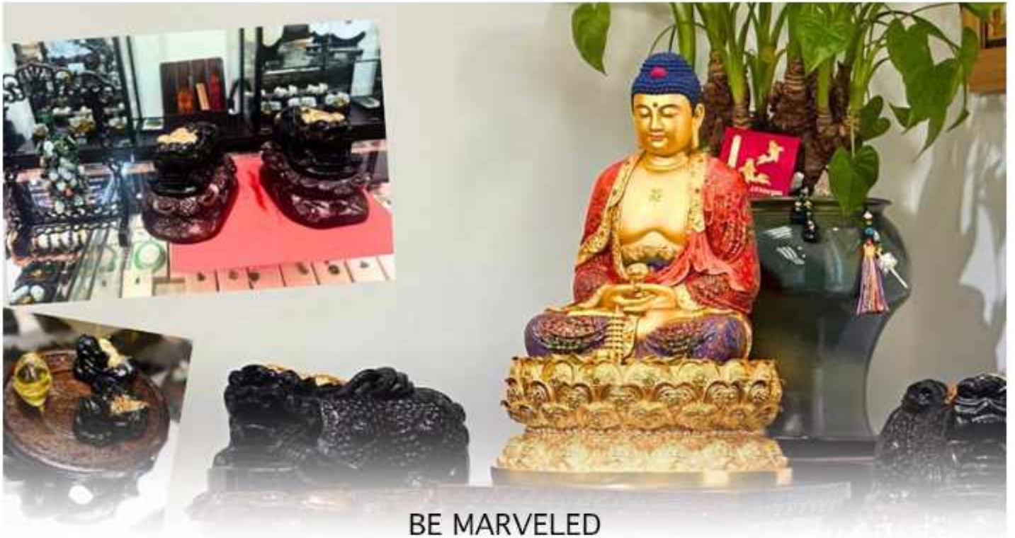
BE MARVELED ศูนย์ปิ๊เซี่ยะ

และนำท่านชม ศูนย์ปิ๊เซี่ยะ ซึ่งคนจีนนั้น ถือว่าหยกเป็นหิน ที่เป็นตัวแทนของความสวยงามและความบริสุทธิ์มีความเชื่อว่าหยก มงคล ถ้าพกติดตัวไว้จะอายุยืนและสุขภาพดีมีสินค้ามากมายเกี่ยวกับหยก อาทิ กำไลหยก หรือสัตว์นำโชคอย่างปิ๊เซี่ยะ ให้ท่านได้เลือกซื้อเป็นของฝาก, ของที่ระลึก หรือของนำโชคแต่ตัวท่านเอง