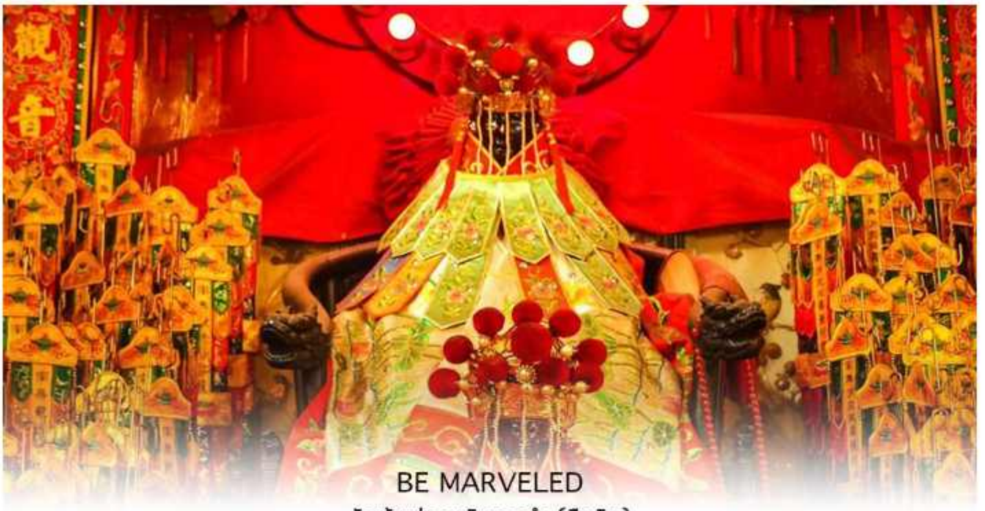
BE MARVELED วัดเจ้าแม่กวนอิมฮองฮำ (ยิมวิน)

นำท่านชม ศูนย์ดวงจู้ยี้ กังหันเศรษฐี ที่ขึ้นชื่อของฮ่องกง ท่านจะได้พบกับงานดีไซน์ที่ได้รับรางวัลยอดเยี่ยม และใช้ใน การเสริมดวงเรื่องดวงจู้ยี้ ศูนย์ดวงจู้ยี้กังหันเศรษฐี วัดแชกง" ไม่ใช่ชื่อวัดโดยตรง แต่เป็นชื่อที่เกี่ยวข้องกับ วัดแชกงหมิว (Che Kung Temple) ในฮ่องกง ซึ่งเป็นที่รู้จักกันดีในเรื่อง กังหันนำโชค ที่เชื่อว่าสามารถหมุนปัดเป่าสิ่งชั่วร้ายและนำโชคลาภเข้ามาในชีวิต