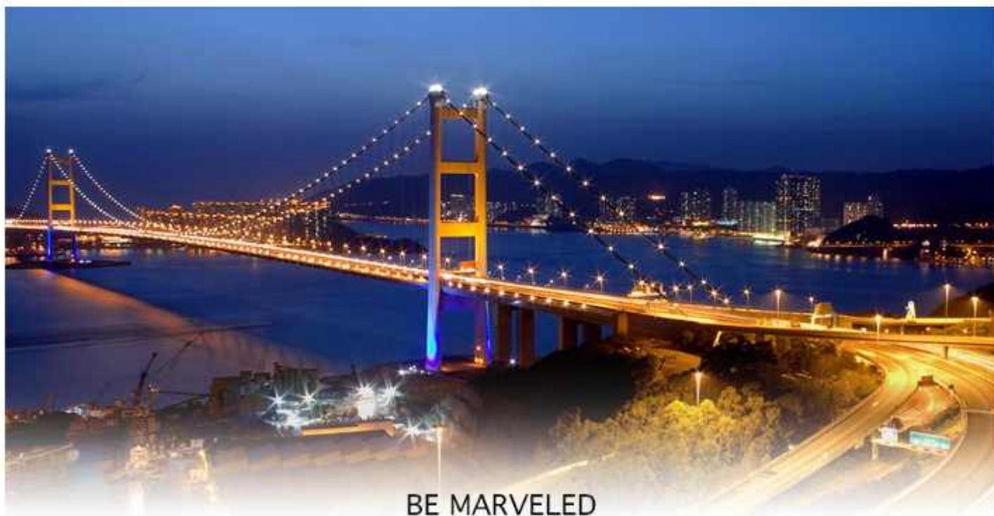
BE MARVELED สะพานแขวนฉิงหม่า

18.15 น. เดินทางถึง สนามบินเซ็กแล็บก๊อก (CHEK LAP KOK INTERNATIONAL AIRPORT) เขตปกครองพิเศษฮ่องกง หลังผ่านพิธีการตรวจคนเข้าเมืองเป็นที่เรียบร้อยแล้ว รับกระเป๋าสัมภาระ เดินทางโดยรถโค้ชปรับอากาศ (เวลาที่อึ้งถึงที่ฮ่องกงเร็วกว่าประเทศไทย 1 ชั่วโมง)