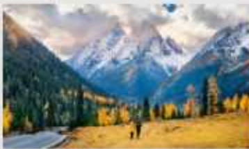
ภูเขาสี่ดรุณี (หุบเขาหวงเฉียวโกว)