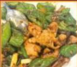
หมูผัดพริกหยวก