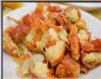
กุ้งมังกรอบซีส