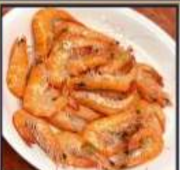
กุ้งหวานลวก