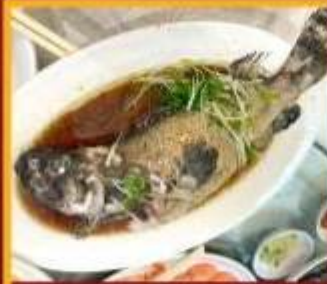
ปลาหนังซีอิ๊ว