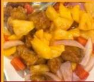
กระดุกหมูผัดเปรี้ยวหวาน