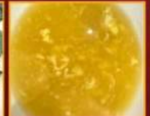
ซุปรสข้าวโพด