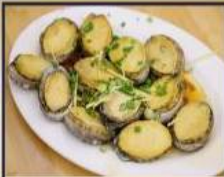
เป๋าฮื้อสดนึ่ง