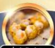
ติ่มซำคัมตำรับ

การันตี! ที่พัก 4 ดาว THE KOWLOON HOTEL ติดถนนนาธาน ย่านช้อปปิ้งจิมซาจอย