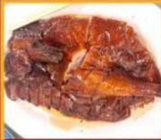
ท่านอย่าง