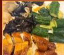
ไก่ แดงกว่า เห็ดหูหนู