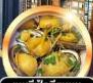
เมนูซีฟู้ดลิ้นจี่