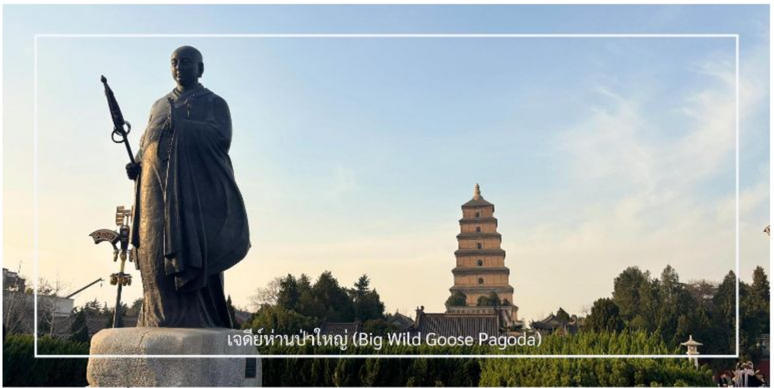
เจดีย์ห่านป่าใหญ่ (Big Wild Goose Pagoda)

จากนั้นนำท่าน สัมผัสประสบการณ์การเข้าสู่จีนโบราณ แต่งกายย้อนยุคในสไตล์ราชวงศ์ถัง เพื่อถ่ายภาพเป็นที่ระลึกบน ถนนวัฒนธรรมราชวงศ์ถัง ซึ่งรายล้อมไปด้วยสถาปัตยกรรมและบรรยากาศที่สะท้อนความรุ่งเรืองของจีนในอดีต ผู้ร่วมเดินทางสามารถเลือกชุดหลากหลายรูปแบบ ทั้งชุดขุนนาง ชุดสตรีชั้นสูง หรือชุดพื้นเมืองโบราณ เพื่อเก็บภาพความประทับใจเสมือนได้ย้อนเวลากลับไปสู่ยุคทองแห่งประวัติศาสตร์จีน