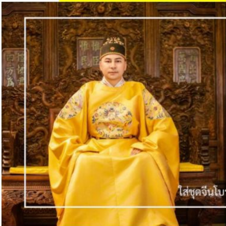
ใส่ชุดจีนโบราณถ่ายรูป

หมายเหตุ: ราคาทัวร์รวมเฉพาะค่าเช่าชุดจีนโบราณเท่านั้น ไม่รวมค่าบริการแต่งหน้า ทำผม และอุปกรณ์เสริมเพิ่มเติม ซึ่งท่านสามารถเลือกใช้บริการได้ตามความสมัครใจ ณ สถานที่