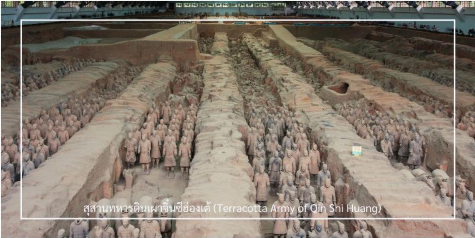
สุสานทหารดินเผาฉินซีฮ่องเต้ (Terracotta Army of Qin Shi Huang)