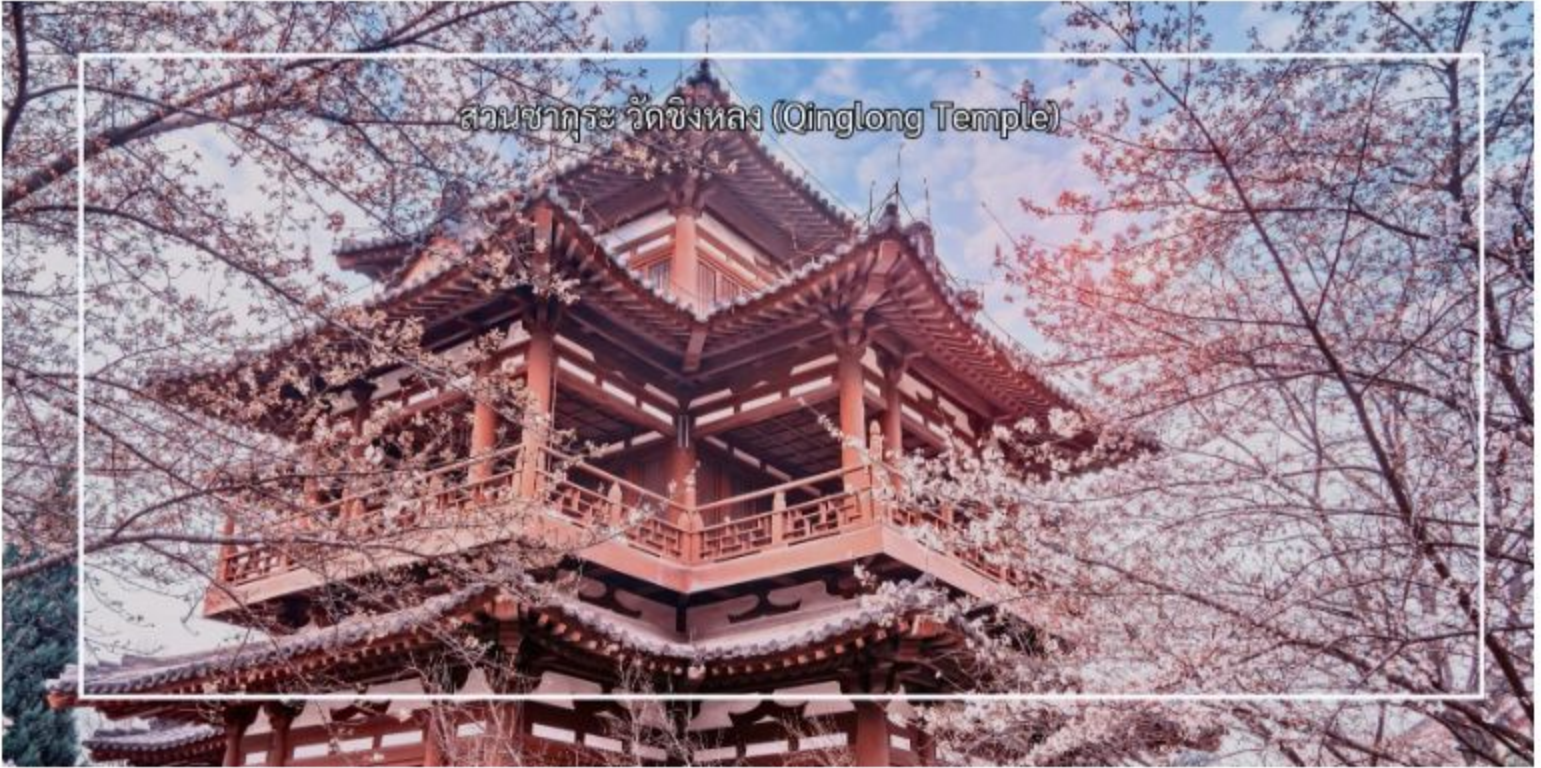
สวนชาคุระ วัดชิงหลง (Qinglong Temple)

จากนั้นนำท่านผ่านชม จัตุรัสหอกลองหอรระฆัง (Xi'an Drum & Bell Tower) ตั้งอยู่ใจกลางเมืองซีอาน สำหรับตัวหอรระฆังนั้นสร้างจากอิฐและไม้ เป็นอาคารหลังคาสามชั้น มีความสูงทั้งหมด 36 เมตร เป็นหอรระฆังที่มีขนาดใหญ่ที่สุด และรักษาไว้สมบูรณ์แบบที่สุดของจีนโบราณที่สืบทอดจนถึงปัจจุบัน ส่วนหอกลองนั้นเป็นอาคารสองชั้นที่รับน้ำหนักด้วยผนังหลังนี้สูง 34 เมตร มีความยาวจากตะวันออกรจรดตะวันตก 52.6 เมตร และความกว้างจากเหนือจรดใต้ 38 เมตร หอคอยทั้งสองได้ชื่อว่าเป็น “ตึกสองพี่น้อง” หรือ “ระฆังรุ่งอรุณและกลองรัตติกาล” เนื่องจากประเทศจีนในอดีตโดยเฉพาะราชวงศ์หยวนนั้น จะมีการตีกลองเพื่อบอกเวลาและเดือนภัยยามมีสถานการณ์ฉุกเฉิน โดยการให้สัญญาณบอกเวลานั้น ยามเช้าใช้เสียงระฆัง และยามค่ำใช้เสียงกลอง