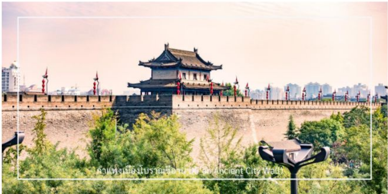
กำแพงเมืองโบราณซีอาน (Xi'an Ancient City Wall)

นำท่านเดินทางสู่ เจดีย์ห่านป่าใหญ่ (Big Wild Goose Pagoda) ซึ่งตั้งอยู่ภายในบริเวณ วัดต้าซือเอิน (Da Ci'en Temple) สถานที่สำคัญทางพุทธศาสนาและประวัติศาสตร์ของจีน สร้างขึ้นในปี ค.ศ. 652 สมัยราชวงศ์ถัง เพื่อเก็บรักษาพระไตรปิฎกและพระธรรมคัมภีร์ที่ พระถังซำจั๋ง อัญเชิญกลับจากชมพูทวีป เจดีย์มีลักษณะทรงสี่เหลี่ยมแบบชั้นบันได สร้างด้วยอิฐเผา สะท้อนศิลปะจีนที่ผสมผสานอิทธิพลจากอินเดีย เดิมสูง 5 ชั้น ต่อมาได้รับการบูรณะจนมีความสูง 7 ชั้น (ประมาณ 64 เมตร) เป็นแบบอย่างของสถาปัตยกรรมพุทธศิลป์ุคราชวงศ์ถังที่เรียบง่ายแต่ทรงพลัง ปัจจุบันเจดีย์แห่งนี้ถือเป็นสัญลักษณ์ทางวัฒนธรรมของเมืองซีอานและสถานที่ท่องเที่ยวยอดนิยมที่ควรมาเยือน