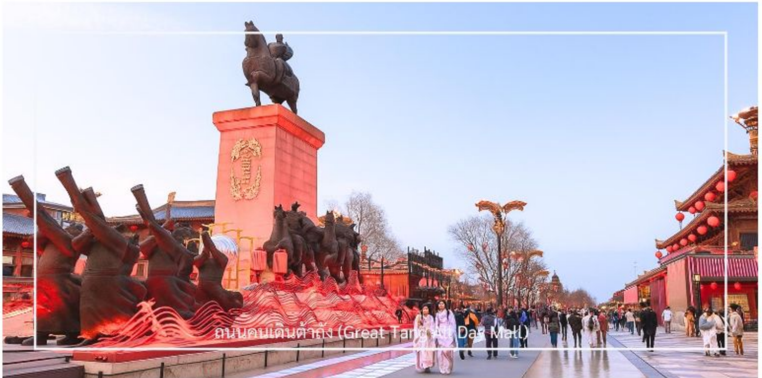
ถนนคนเดินต้าถัง (Great Tang All Day Mart)

ประยุกต์ ผสมผสานกลิ่นอายโบราณเข้ากับความร่วมมือได้อย่างลงตัว เต็มอิมกับการเลือกชมและเลือกซื้อสินค้าในร้านค้าของที่ระลึก คาเฟ่ ร้านอาหาร และเครื่องดื่มชื่อดัง พร้อมชม การแสดงศิลปะพื้นบ้านกลางแจ้ง ไม่ว่าจะเป็นดนตรีสด การแสดงหุ่นเงา การรำโบราณ รวมถึงการแสดงแสง สี เสียง ตามจุดต่าง ๆ ตลอดแนวถนน พร้อมชมความงดงามของบรรยากาศที่เต็มไปด้วยแสงสีของดวงไฟที่สาดส่องสว่างไสวอย่างสวยงาม