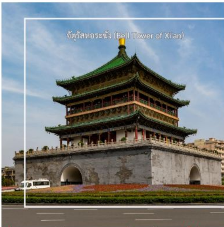
จัตุรัสหอระฆัง (Bell Tower of Xi'an)