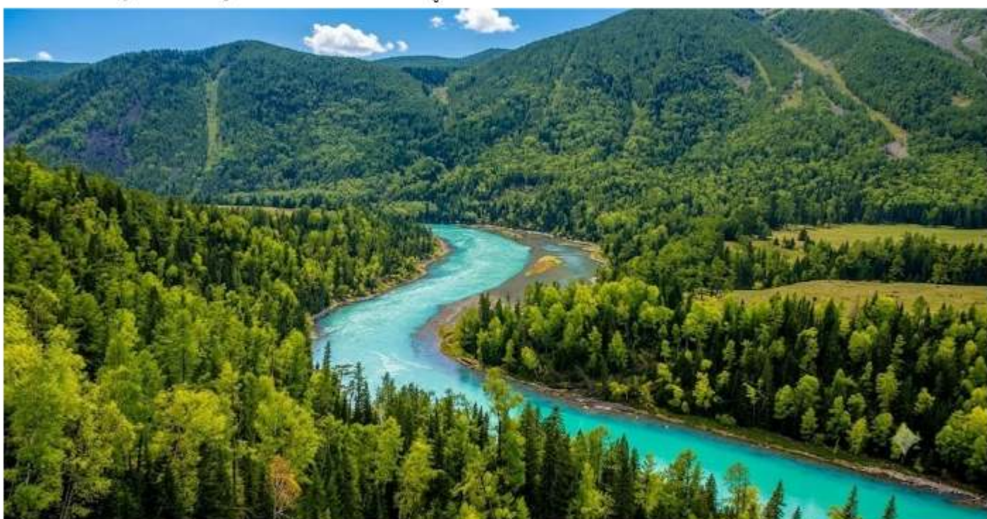
โค้งนางฟ้า (Fairy Bay / 仙女湾 - Xiānnǚ Wān): โค้งน้ำช่วงที่นิ่งสงบและมักจะมีหมอกจางๆ ปกคลุมในตอนเช้า ให้ความรู้สึกราวกับดินแดนแห่งเทพนิยาย

เที่ยง รับประทานอาหารกลางวัน ณ ภัตตาคาร จากนั้น ศาลาปลา หรือ ศาลาชมปลา (Guanyu Pavilion - 观鱼亭) เป็นจุดชมวิวระดับแลนด์มาร์คที่ตั้งอยู่บนยอดเขาฮาลาไคด์ (Harakat) สูงจากระดับน้ำทะเลประมาณ 2,030 เมตร ในเขต อุทยานคานาสือ (Kanas Lake) ทางตอนเหนือของซินเจียง ประเทศจีน เป็นจุดเดียวที่สามารถมองเห็นทัศนียภาพของทะเลสาบคานาสือได้เกือบทั้งหมดแบบพาโนรามา มีบันไดกว่า 1,068 ขั้น เพื่อขึ้นไปยังตัวศาลา แต่ระหว่างทางจะมีจุดพักและวิวทิวทัศน์ที่สวยงามของเทือกเขาอัลไตและยอดเขามิตรภาพให้ได้ถ่ายรูปตลอดทาง