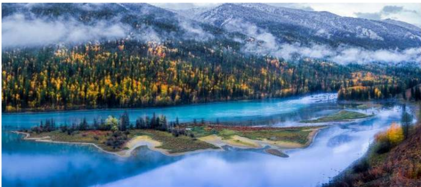
โค้งพระจันทร์ครึ่งเสี้ยว (Moon Bay / 月亮湾 - Yuèliàng Wān): เป็นโค้งรูปตัว S ที่สวยงามและมีชื่อเสียงที่สุด เป็นสัญลักษณ์สำคัญของทะเลสาบคานาส โดยรูปร่างโค้งจะเปลี่ยนไปตามระดับน้ำ