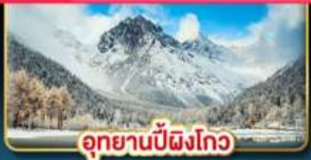
อุทยานปี้ผิงโกว