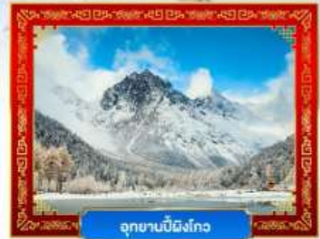
อุทยานปี้มิงโกว