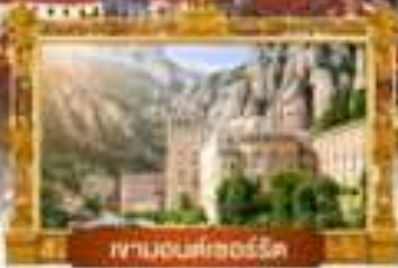
ภูเขาโดโลมา