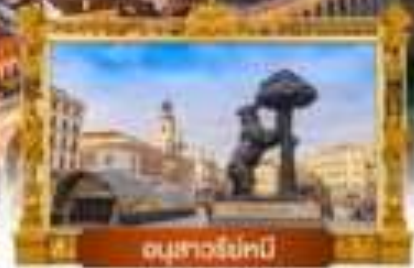
อนุสาวรีย์หนี

เมนู พิเศษ! ข้าวผัดลูปเป + ทุยกับอิมเลียงชือ