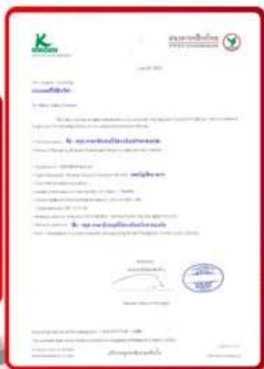
ตัวอย่าง Bank Guarantee ที่ผู้สมัครควรเตรียมเอกสาร