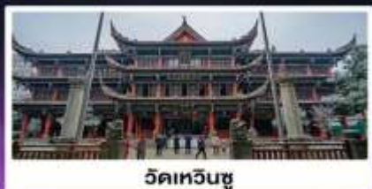
วัดเหวินซู่