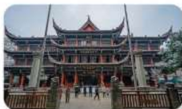
วัดเหวินซู