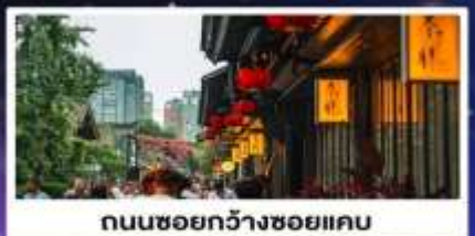
ถนนชอยกว้างชอยแคบ