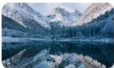
ปี้ฝิงโกว