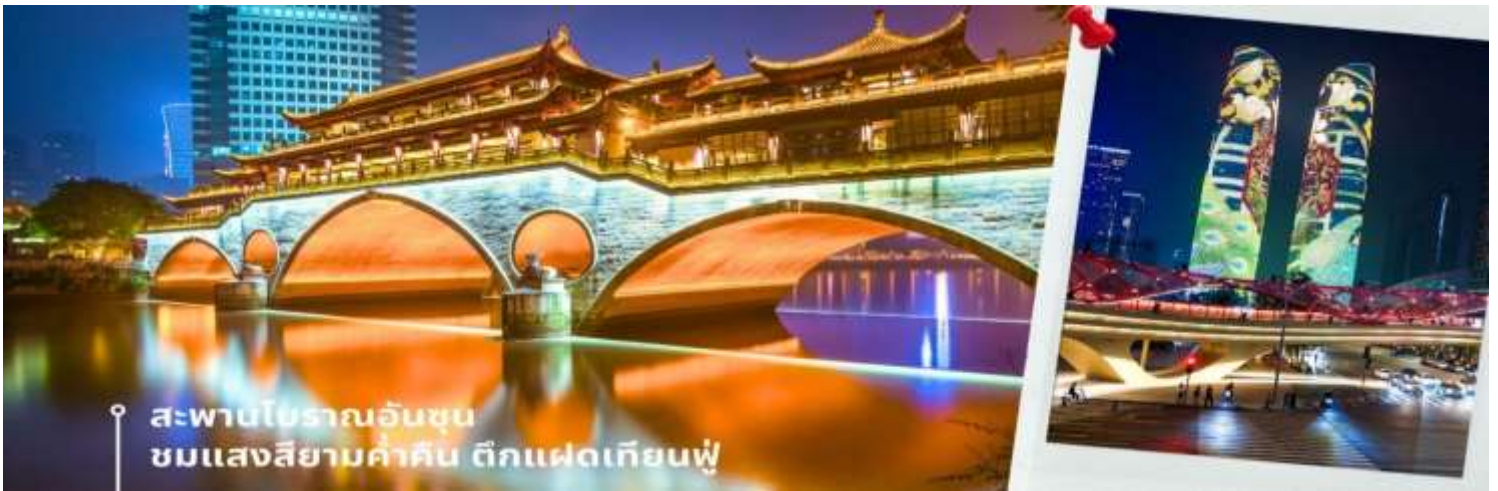
สะพานโบราณอันซุน ชมแสงสียามค่ำคืน ตึกแฝดเทียนฟู

นำท่านชม สะพานอันซุน ตั้งตระหง่านเหนือแม่น้ำจิน ใจกลางเมืองเฉิงตู มณฑลเสฉวน ประเทศจีน สะพานหินห้าโค้ง แห่งนี้ ไม่ได้เป็นเพียงทางข้ามที่เชื่อมต่อสองฝั่งแม่น้ำเท่านั้น แต่ยังเป็นสัญลักษณ์อันงดงามของเมือง สะท้อนถึง วัฒนธรรม ประวัติศาสตร์ และวิถีชีวิตของชาวเฉิงตูมายาวนานกว่า 300 ปี ด้วยความวิจิตรบรรจงของสถาปัตยกรรม แบบดั้งเดิม สะพานหินแกะสลักประณีต ประดับประดามีกรรมรูปสัตว์ในตำนาน เช่น มังกร สิงโต และฟีนิกซ์ สะท้อนให้เห็นถึงความเชื่อ ศรัทธา และจินตนาการของผู้คนในยุคหนึ่ง สะพานแห่งนี้เปรียบเสมือนเส้นทางข้ามกาลเวลา เชื่อมโยงอดีต ปัจจุบัน และอนาคตเข้าไว้ด้วยกัน ด้วยความงดงามและเสน่ห์อันเป็นเอกลักษณ์ สะพานโบราณ กลายเป็นแรงบันดาลใจให้กับศิลปิน นักเขียน และนักดนตรีมากมาย ปรากฏในภาพวาด บทกวี เพลง และภาพยนตร์