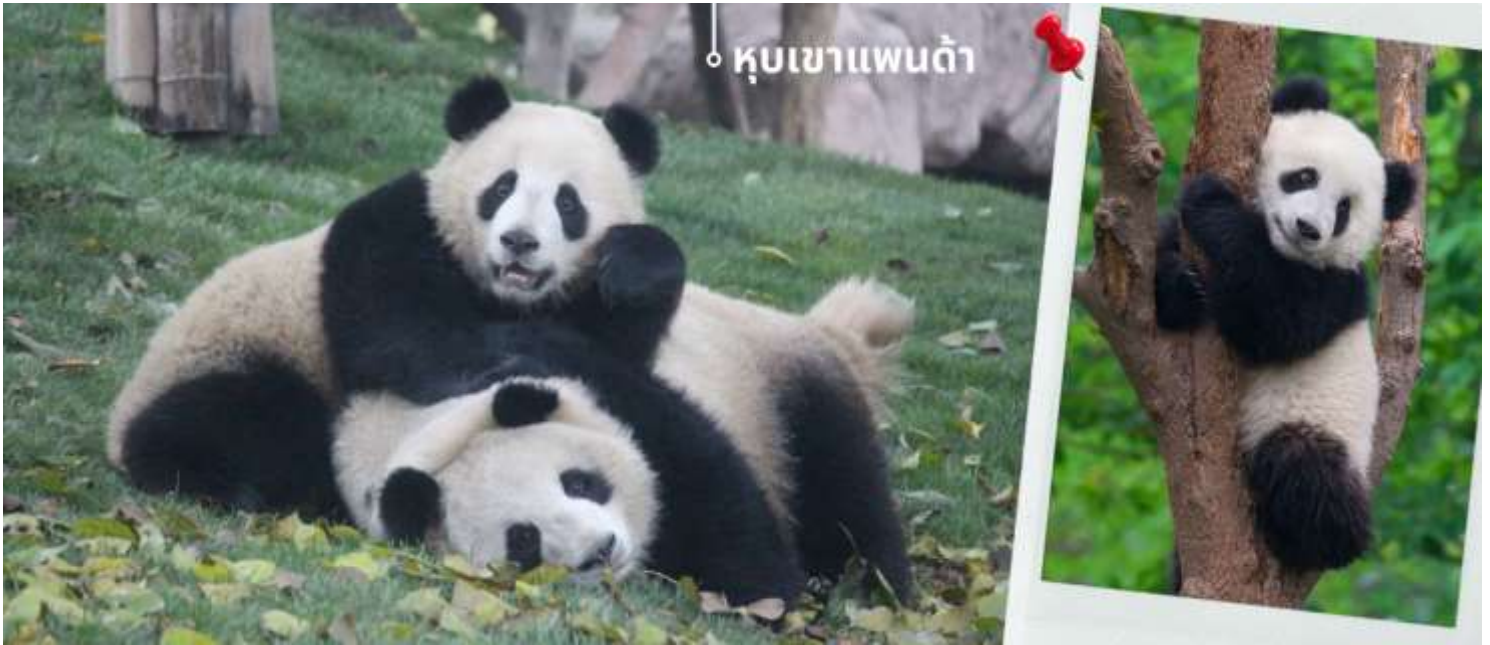
หุ้บเขาแพนด้า

จากนั้นนำท่านเดินทางไปยัง ร้านหนังสือจงซูเกอ (Zhongshuge) ในเมืองตูเจียงเยียน มณฑลเสฉวน ประเทศจีน เป็นหนึ่งในร้านหนังสือที่สวยงามที่สุดของจีน โดดเด่นด้วยการออกแบบภายในที่เล่นกับกระจกสะท้อน เพดานโค้ง และบันไดวน ทำให้รู้สึกเหมือนเดินอยู่ในโลกแฟนตาซี แสงบันไดลึบจากระบบชลประทานโบราณตูเจียงเยียนอายุกว่า 2,000 ปี ภายในมีหนังสือมากกว่า 80,000 เล่ม ครอบคลุมหลายแนว ทั้งยังมีมุมอ่านหนังสือสบาย ๆ คาเฟ่เล็ก ๆ และมุมถ่ายรูปสุดชิค เหมาะทั้งคนรักการอ่านและคนชอบถ่ายภาพ