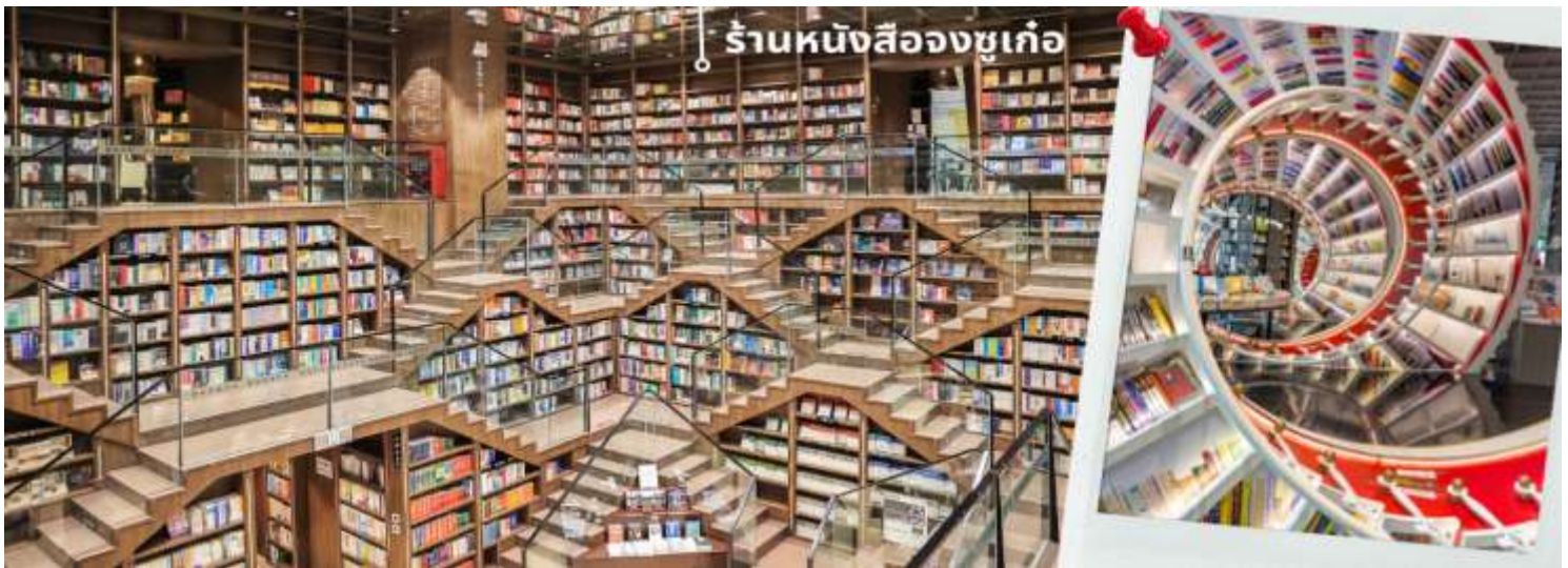
ร้านหนังสือจงซูเกอ

จากนั้นนำท่านเดินทางไปยัง ร้านหนังสือจงซูเกอ (Zhongshuge) ในเมืองตูเจียงเยียน มณฑลเสฉวน ประเทศจีน เป็นหนึ่งในร้านหนังสือที่สวยงามที่สุดของจีน โดดเด่นด้วยการออกแบบภายในที่เล่นกับกระจกสะท้อน เพดานโค้ง และบันไดวน ทำให้รู้สึกเหมือนเดินอยู่ในโลกแฟนตาซี แสงบันไดลึบจากระบบชลประทานโบราณตูเจียงเยียนอายุกว่า 2,000 ปี ภายในมีหนังสือมากกว่า 80,000 เล่ม ครอบคลุมหลายแนว ทั้งยังมีมุมอ่านหนังสือสบาย ๆ คาเฟ่เล็ก ๆ และมุมถ่ายรูปสุดชิค เหมาะทั้งคนรักการอ่านและคนชอบถ่ายภาพ