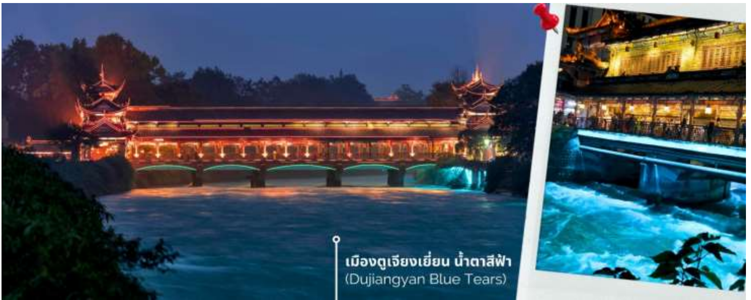
เมืองดูเจียงเยียน น้ำตาสีฟ้า (Dujiangyan Blue Tears)

ค่ำ 📍 รับประทานอาหารค่ำ ณ ภัตตาคาร (3) เมนูพิเศษ!! สุกี้ไก่ตุ๋นเกาหลี