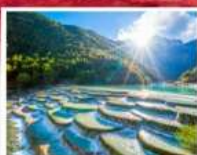
ทะเลสาบปีหยุนเหอ