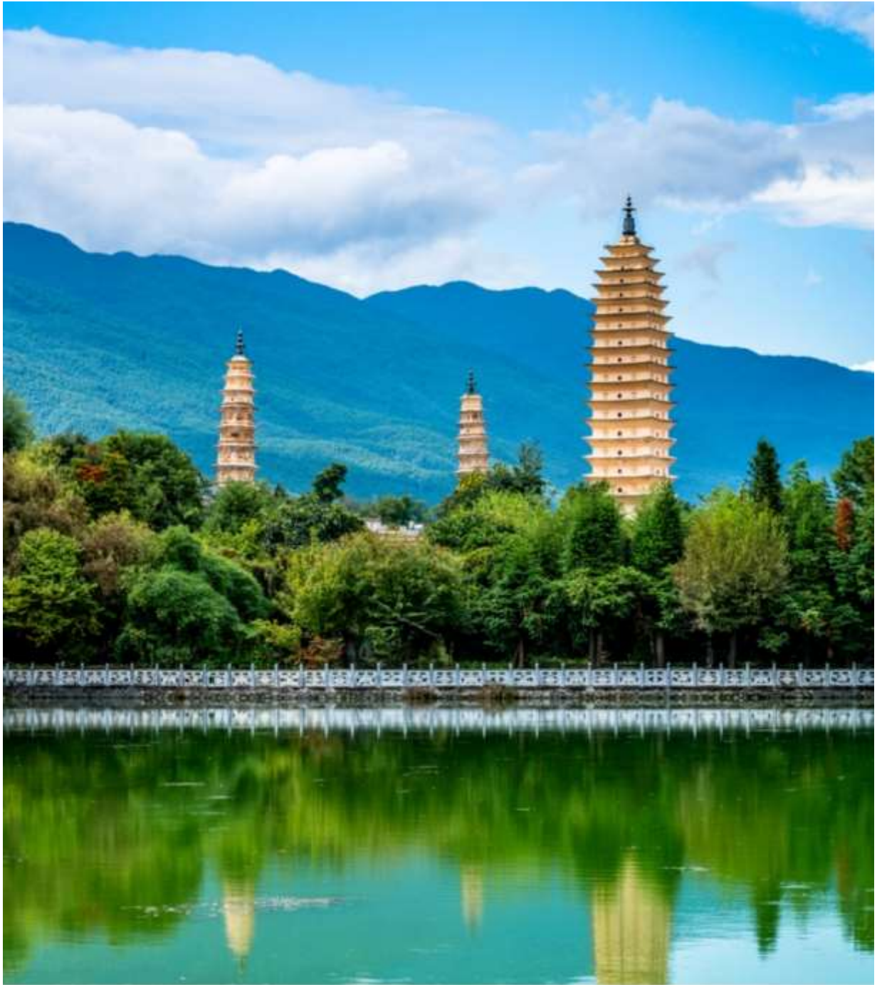
นำท่านเดินทางเข้าสู่เมืองเก่าต้าหลี่ ชมเจดีย์สามองค์แห่งวัดจงเซิ่ง Three Pagodas of Chongsheng Temple ตั้งตระหง่านอยู่บริเวณหน้าวัดจงเซิ่ง สร้างขึ้นในสมัยราชวงศ์ถัง ที่แสดงให้เห็นถึงเทคนิคการก่อสร้างอันล้ำยุค และอิทธิพลของพุทธศาสนาที่รุ่งเรืองในอดีต วัดจงเซิ่งและเจดีย์สามองค์ ถือได้ว่าเป็นสถานที่สำคัญแห่งหนึ่งของเมืองต้าหลี่และมณฑลยูนนาน โดยมีตำนานเล่าว่าพื้นที่เมืองต้าหลี่เคยประสบอุทกภัยรุนแรงบ่อยครั้ง เชื่อกันว่าเป็นเพราะมีมังกรน้ำอาศัยอยู่ การสร้างเจดีย์ทั้งสามองค์ (รวมถึงการประดิษฐานนกปักษีทองไว้บนยอดเจดีย์) เพื่อสะกดมังกรน้ำมิให้สร้างภัยพิบัติและนำมาซึ่งความสงบสุขของชาวเมือง