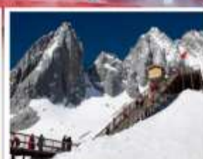
ภูเขาหิมะมิงกรหยก