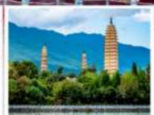
ชมเจดีย์สามองค์แห่งวิดองเซียง