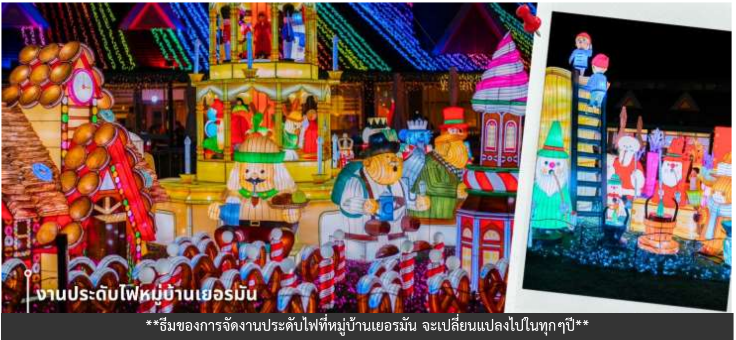
งานประดับไฟหมู่บ้านเยอรมัน

จากนั้นนำท่านเดินทางชม งานประดับไฟหมู่บ้านเยอรมัน (Tokyo German Village) คือชื่อของธีมพาร์คสไตล์หมู่บ้านเยอรมัน หรือเทศกาลประดับไฟฤดูหนาวของที่นี่ ซึ่งจัดติดต่อกันมามากกว่า 10 ปี ตั้งอยู่ในจังหวัดชิบะ บนพื้นที่ขนาดใหญ่กว่า 60,000 ตารางเมตร ที่จำลองบรรยากาศของฟาร์มในชนบทประเทศเยอรมนีมาไว้ที่ญี่ปุ่น ได้อย่างสวยงาม และมีการจัดงานประดับไฟช่วงฤดูหนาว Tokyo German Village Winter illumination เป็นงานประดับไฟฤดูหนาวที่ยิ่งใหญ่ลงการจนได้ชื่อว่าเป็น 1 ใน 10 งานประดับไฟที่สวยงามที่สุดในญี่ปุ่น ในแต่ละปีก็ยังมีธีมการจัดแสดงไฟและธีมงานที่แตกต่างกันไป ซึ่งจะเป็นสถาปัตยกรรมสไตล์เยอรมันที่ประดับตกแต่งด้วยแสงไฟสวยงาม โดยจะประดับหลอดไฟหลากสีสนทั้งสีนกว่า 3 ล้านดวงจนแสงสว่างพราว สว่างไสวไปทั่วทั้งบริเวณภายในพาร์ค ซึ่งให้ความรู้สึกราวกับหลุดเข้าไปอยู่ในเทพนิยาย อีกทั้งโชว์ ที่นี้มีการแสดงแสงสีเสียง 3D illumination ที่เน้นศิลปะและเทคโนโลยีที่สอดคล้องกับธีมในแต่ละปีเข้าไว้ด้วยกันช่วยสร้างบรรยากาศให้ยิ่งคึกคักและเพิ่มความสวยงามให้กับธีมพาร์คแห่งนี้ยิ่งขึ้นไปอีก ให้ท่านอิสระเก็บภาพความประทับใจตามอธยาศัย