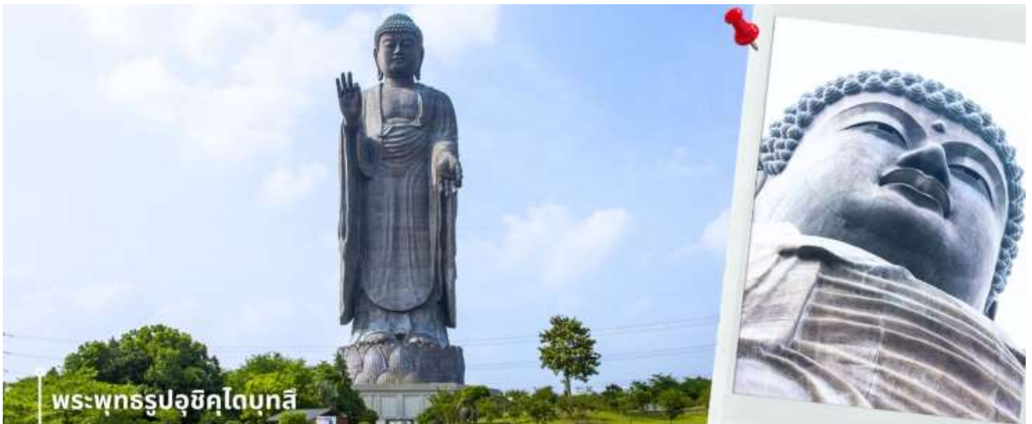
พระพุทธรูปอุชิคุไดบุทสึ

หลังรับประทานอาหารเช้าเที่ยง นำท่านเดินทางชม พระพุทธรูปปางยืน ที่องค์ใหญ่ติดอันดับโลก นั่นก็คือ พระพุทธรูปอุชิคุไดบุทสึ โดยในปี ค.ศ.1995 ได้รับการบันทึกลงในกินเนสบุ๊กว่า เป็นพระพุทธรูปปางยืนที่หล่อด้วยสัมฤทธิ์ที่สูงที่สุดในโลก โดยสูงถึง 120 เมตร และยังสูงเป็นอันดับที่ 3 ของโลก พระพุทธรูปอุชิคุไดบุทสึ ถูกสร้างขึ้น ในปีค.ศ. 1992 บนพื้นที่บริสุทธิ์ของสุสาน และปีต่อมาก็ถูกทำให้เป็นสวนสาธารณะ และยิ่งไปกว่านั้น บริเวณรอบๆ พระพุทธรูปจะเป็นสวนสาธารณะ ที่มีการปลูกดอกไม้ตามฤดูกาลไว้อย่างงดงาม ภายในสวนยังมีดอกไม้บานนานาพันธุ์ให้ท่านได้ชม ไม่ว่าจะเป็น ดอกไฮเดรนเยีย โบตัน ซากุระ ต้นฟลอกสมอส ป๊อบบี้ และคอสมอส เป็นต้น ซึ่งสลับกันแบ่งบานตลอดทั้งปี แต่ทั้งนี้ก็ขึ้นอยู่กับฤดูกาลและชนิดของดอกไม้ ให้ท่านได้อิสระเดินชมและเก็บภาพความประทับใจ