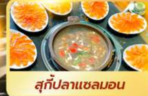
สุกี้ปลาเซลมอน