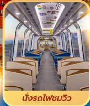
นั่งรถไฟชมวิว