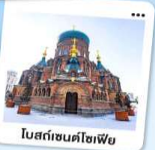
โบสถ์ซันต์โซเฟีย