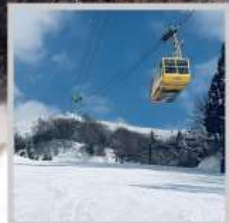
"ZAO CHUO ROPEWAY"