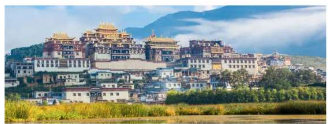
ของชาวทีเบต วัดจ้านหลินชื่อนี้ถือว่าเป็นศูนย์กลางแห่งพุทธศาสนิกชนในบริเวณที่ราบสูง ทีเบตนั่นเอง ท่านจะได้สัมผัสกับวัฒนธรรมของชาวทีเบตเพราะที่นี่คือเขตทีเบตน้อย

นำชมวัดซงจ้านหลืน วัดลามะที่มีอายุเก่าแก่กว่า 300 ปี มีพระลามะจำพรรษาอยู่มากกว่า 700 รูป สร้างขึ้นโดยทะไลลามะองศ์ที่ 5 ในปี พ.ศ. 2222 ใช้เวลาก่อสร้าง 18 ปี จึงแล้ว เสร็จโดยจักรพรรดิแห่งราชวงศ์ชิง วัดจ้านหลืนชื่อมีรูปแบบคล้ายพระราชวังโปตาลาที่นคร ลาซาแห่งทีเบต แต่ขนาดมีการย่อส่วนลงมา หากว่าโปตาลาเป็นศูนย์รวมจิตใจ