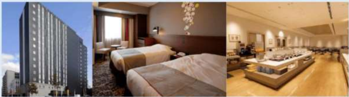
ภาพใช้เพื่อประกอบการโฆษณาเท่านั้น