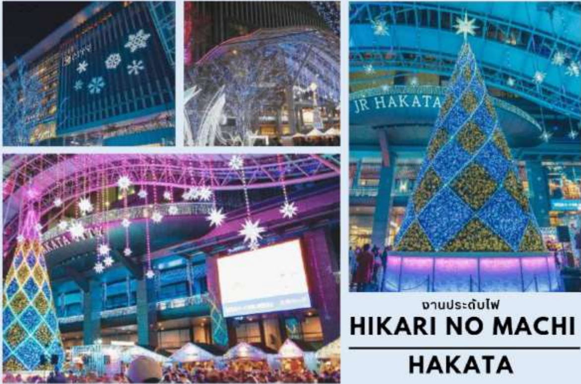
งานประดับไฟ HIKARI NO MACHI HAKATA

คริสต์มาสขนาดยักษ์ความสูงถึง 14 เมตร ที่สว่างไสวด้วยลวดลายแสงไฟสุดประณีต นอกจากนี้พื้นที่รอบสถานี JR Hakata ยังมีตลาดนัดเล็กๆเปิดขายของเซ่น ขนม ของที่ระลึก และของทานเล่นอีกด้วย