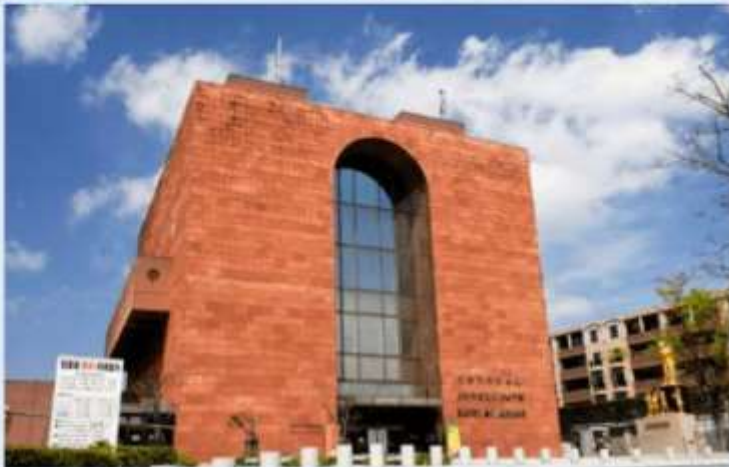
ATOMIC BOMB MUSEUM NAGASAKI

จากนั้นนำท่านแวะชม สะพานเมงะเนบashi (Meganebashi) หรือ “สะพานแว่นตา” สะพานหินโค้งคู่เก๋ไก๋ที่ทอดข้ามแม่น้ำนาคาชิมะ (Nakashima River) ซึ่งได้ชื่อว่าเป็นสะพานหินรูปโค้งคู่แห่งแรกของญี่ปุ่น เมื่อเงาสะพานสะท้อนลงในสายน้ำ จะเห็นเป็นรูปวงกลมคล้ายแว่นตาอย่างสวยงาม เป็นหนึ่งในจุดถ่ายภาพยอดนิยมของเมืองนางาซากิ รายล้อมด้วยบรรยากาศอันยอดเยี่ยม บ้านเรือนเก่า และทางเดินเลียบริมแม่น้ำ