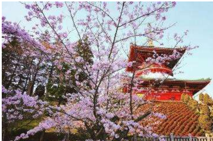
โรงแรมที่พักประมาณ 5 นาที

- วัดนาริตะซัง ชินโซจิ (Naritasan Shinsho-ji Temple) เป็นวัดพุทธเก่าแก่ในเมืองนาริตะ สร้างขึ้นในปี ค.ศ. 940 และเป็นที่รู้จักในฐานะสถานที่ท่องเที่ยวทางวัฒนธรรมที่เดินทางง่ายเนื่องจากอยู่ใกล้สนามบินนาริตะ ภายในวัดมีอาคารเก่าแก่หลายหลัง เช่น เจดีย์สามชั้น และห้องโถงหลักที่สวยงาม พร้อมสวนญี่ปุ่นให้พักผ่อน และมีถนนโอโมเตะซังโตะที่มีร้านค้า และร้านอาหารให้เลือกมากมาย นอกจากนี้ยังเป็นวัดที่มีชื่อเสียงเรื่องการขอพรให้เดินทางปลอดภัย และพิธีกรรมทางศาสนาต่าง ๆ ใช้เวลาเดินทางจาก