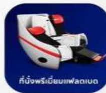
ที่นั่งพรีเมียมเฟล็กซิเบิ้ล