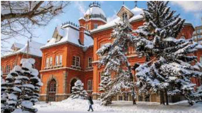
FORMER HOKKAIDO GOVERNMENT OFFICE

จากนั้นนำท่านสู่ ศาลาว่าการเก่าเมืองฮอกไกโด (Former Hokkaido Government Office) (ด้านนอก) เป็นอาคารที่สร้างขึ้นจากอิฐสีแดงในปี ค.ศ 1888 ในรูปแบบอเมริกันนีโอบาโรก อาคารซึ่งเป็นสัญลักษณ์ของฮอกไกโดแห่งนี้ เป็นสถานที่จัดนิทรรศการทางประวัติศาสตร์ ร้านค้าพิพิธภัณฑสถาน ศูนย์ข้อมูลนักท่องเที่ยว และห้องประชุม