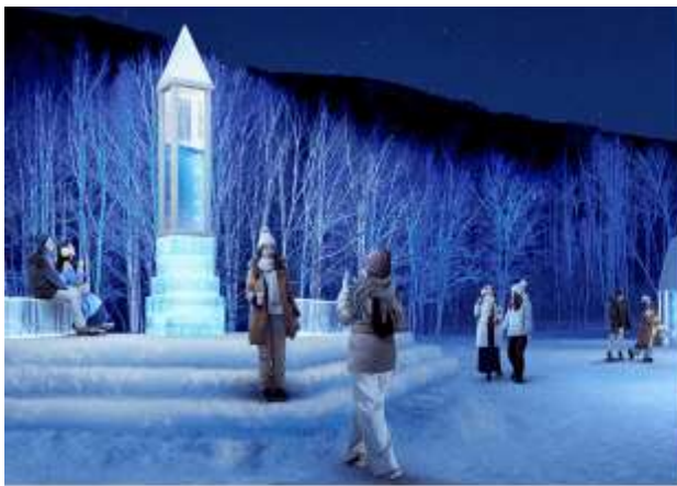
TOMAMU ICE VILLAGE

จากนั้นนำท่านสู่ เมืองชิมุกัปโป (Shimukappu) เป็นเมืองเล็ก ๆ แต่เป็นจุดหมายยอดนิยมสำหรับกิจกรรมฤดูหนาว ในเขตจังหวัดฮอกไกโด (Hokkaido) ตั้งอยู่บริเวณตอนกลางของฮอกไกโด ระหว่างเมืองฟูราโนะ (Furano) และโทคาจิ (Tokachi) เพื่อนำท่านเข้าชม TOMAMU ICE VILLAGE ซึ่งตั้งอยู่ในโฮชิโนะรีสอร์ทโทมามุ (Hoshino Resort Tomamu) เป็นหมู่บ้าน ชั่วคราวที่สร้างขึ้นจากการแกะสลักน้ำแข็งในช่วงฤดูหนาวเท่านั้น บ้านน้ำแข็งแต่ละหลังมีการประดับ ประดาแสงไฟสีส้มต่าง ๆ ไฟงดงามมากยิ่งขึ้น นอกจากนี้ให้การเก็บภาพความสวยงามของบ้านน้ำแข็งแล้ว ยังมี กิจกรรมอื่น ๆ อีกมากมาย เช่น Zipline on Ice จะเคลื่อนตัวลงมาเป็นระยะทางประมาณ 60 เมตร ระหว่างทางท่าน จะไต่ขึ้นชมทิวทัศน์ของหิมะ และลานน้ำแข็งที่น่าอัศจรรย์ Ice Bakery & Cafe คาเฟ่ ที่ให้บริการเครื่องดื่มร้อน และขนม ที่ให้ท่านนั่งทานบนโต๊ะและเก้าอี้น้ำแข็ง Ice Bar บาร์ที่บริการเครื่องดื่มประเภทค็อกเทล และเครื่องดื่มแอลกอฮอล์อื่น ๆ หลายชนิดที่เสิร์ฟในแก้วน้ำแข็งสวย ๆ เป็นต้น (ราคาทัวร์ไม่รวมค่ากิจกรรมและค่าเครื่องดื่ม Ice Bar, Ice Bakery & Cafe) ใช้เวลาเดินทางประมาณ 1.30 ชั่วโมง