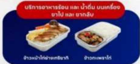
บริการอาหารร้อน และ น้ำดื่ม บนเครื่อง ขาไป และ ขากลับ