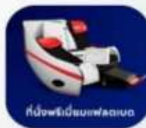
ที่นั่งพรีเมียมเฟลตทอป