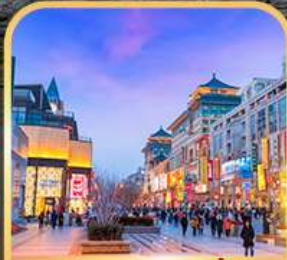
ถนนหวงฟู่จิ่ง