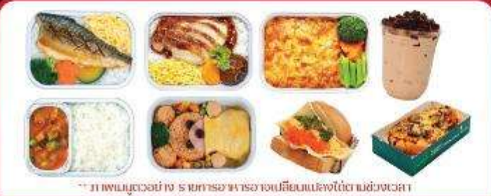
** ภาพเมนูตัวอย่าง รายการอาหารอาจเปลี่ยนแปลงได้ตามช่วงเวลา