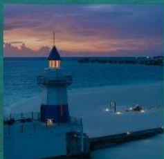
Light House Restaurant