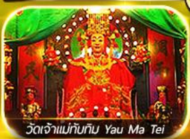
วัดเจ้าแม่ทับทิม Yau Ma Tei