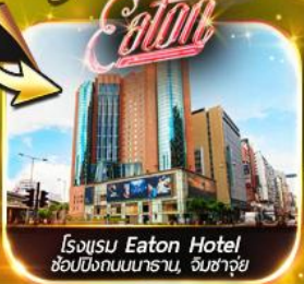
โรงแรม Eaton Hotel ช้อปปิ้งถนนนาราณ, งามซาจิว

ไหว้พระ 8 วัดตั้ง !! ใกล้อีกทั้งนำสวดขอพรตามต้นฉบับคนท้องถิ่น ช้อปปิ้งจุใจ : ย่านดัง งามซาจิว, มงกิก