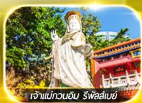
เจ้าแม่ทวนอิม รัชกาลสมัย