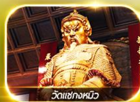
วัดเซกตงหวี