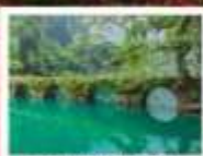
อุทยานเสี่ยวชิว