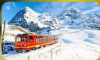
พิกัดยอดเขาจุงเฟรา

พักที่ Pullman Paris Tour Eiffel Hotel Wate !!! คือ: ดินแดนเก่า หรือ: ดินแดนเก่า