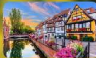
ดินแดนแห่งเทพนิยาย กอลมาร์