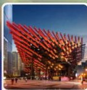
พิพิธภัณฑ์ศิลปะ-เทียน