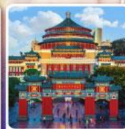
ศาลาประชาชนฉงชิ่ง