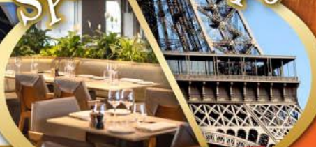
รับประทานอาหารกลางวัน บนหอคอยเฟลา

ไฮไลท์ในโปรแกรม • สะพานไมชาเปเล ลูเซิร์น