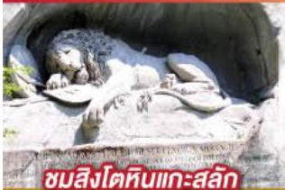
ชมสิงโตหินแกะสลัก