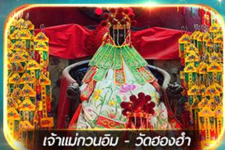
เจ้าแม่กวนอิม - วัดสองอ่า