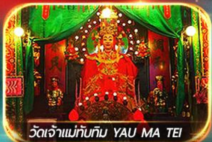
วัดเจ้าแม่ทับทิม YAU MA TEI