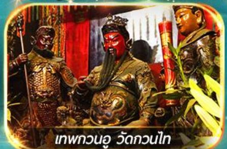
เทพกวนอู วัดกวนไท

พามูไหว้พระ-ขอพร 8 วัดดัง, อิสระช้อปปิ้ง 1 วันเต็มแบบจุใจ หรือเลือกซื้อ OPTION กระเป๋าหนัง 360 / ดิสนีย์แลนด์