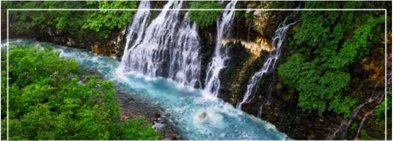
SHIRAHIGE WATERFALL น้ำตกชิราฮิเกะ

วันที่สอง ทำอากาศยานนิวซีโดเสะ สอกโกโด – เมืองบิเอะ – น้ำตกชิราฮิเกะ – สระอะโออิเคะ หรือ บ่อน้ำสีฟ้า – เมืองอาซาสิดาวา – อีออน อาซาสิดาวา