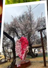
สวนแอปริคอต