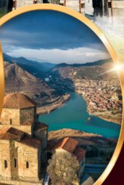
อารามจวารี