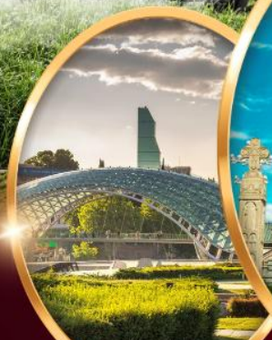
สะพานมิตรภาพ