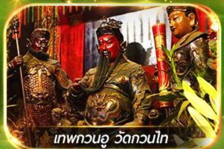
เทพกวนอู วัดกวนไท

ไหว้พระ-จัดเต็มขอพร 9 วัดดัง, นั่งกระเช้ามองปิง สักการะพระใหญ่โป้วหลิน ทะเลสาบดิสนีย์แลนด์ ชมพลุสุดอลังการ !!