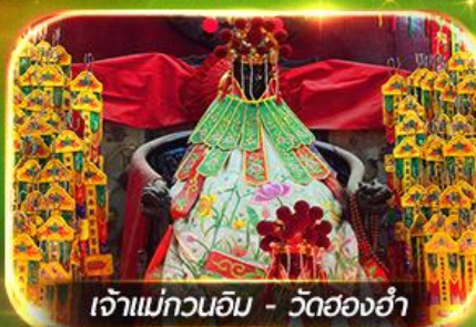
เจ้าแม่กวนอิม - วัดฮ่องกง