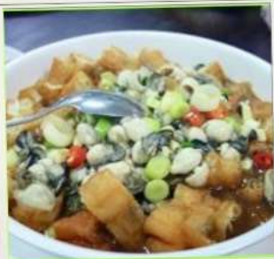
ถนนโบราณซือเฟิ่น