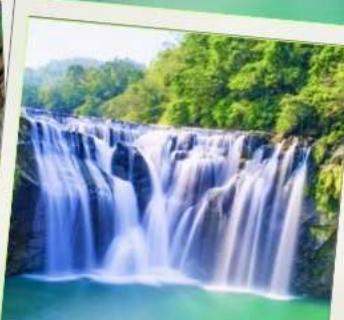
น้ำตกซือเฟิ่น