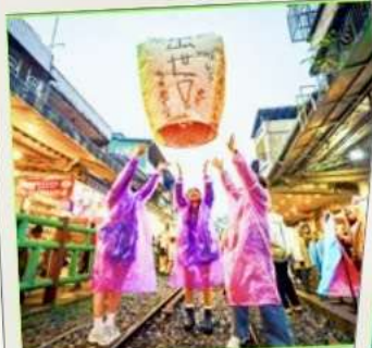
ปล่อยโคมลอย