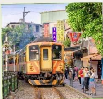
สถานีรถไฟซือเฟิ่น