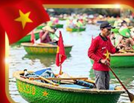
เรือกระด้ง หมู่บ้านกิมทาน