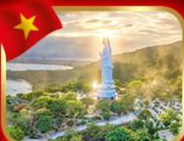
ขอพรกวณอิม วัดหลี่ฮุ้น