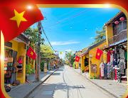
เมืองมรดกโลก ฮอยอัน