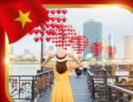
เช็किनสะพานแห่งความรัก