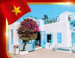
คาเฟ่สุดชิค ซานทรา มาริน่า