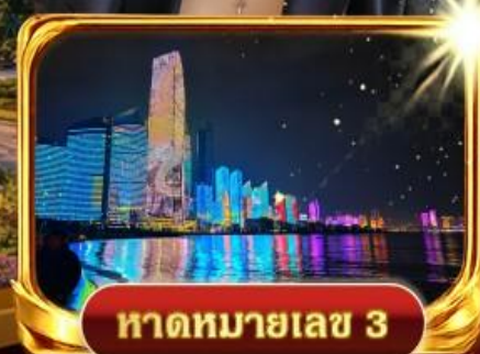
หาดหมายเลข 3