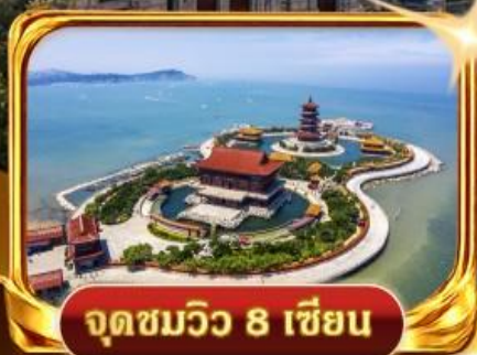
จุดชมวิวกว 8 เซียน