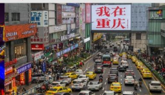
กวนอิมเจียว

*ทางบริษัทฯ ขอสงวนสิทธิ์ในการสลับโปรแกรมทัวร์ตามความเหมาะสมขึ้นอยู่กับสถานการณ์หน้างาน โดยคำนึงถึงผลประโยชน์ของลูกค้าเป็นสำคัญ