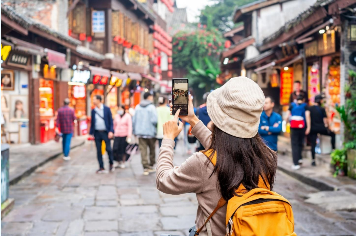
กลางวัน บริการอาหารกลางวัน ณ ภัตตาคารอาหารพื้นเมือง

จากนั้นนำท่านเดินทางสู่ หมู่บ้านโบราณฉือไซ่ว (Ciqikou Ancient Town) เป็นหมู่บ้านอนุรักษ์ ทางวัฒนธรรม และเป็นสถานที่ท่องเที่ยวชื่อดังของมหานครฉงชิ่ง ลักษณะก็คล้ายๆ กับตลาดเก่าหรือตลาดโบราณบ้านเรา สำหรับคนที่อยากไปย้อนเวลากลับไปในอดีตก็ต้องไปเยือน เพราะที่นี่ยังคงรักษาวิถีชีวิต รวมทั้งสะท้อนรากเหง้าดั้งเดิมของเมืองไว้ได้อย่างดีเยี่ยม ไม่ว่าจะเป็นตึกรามบ้านช่องที่มีรูปทรงโบราณ แหล่งผลิตสินค้า และอาหารพื้นเมืองที่สืบทอดกิจการต่อกันมาหลายรุ่น