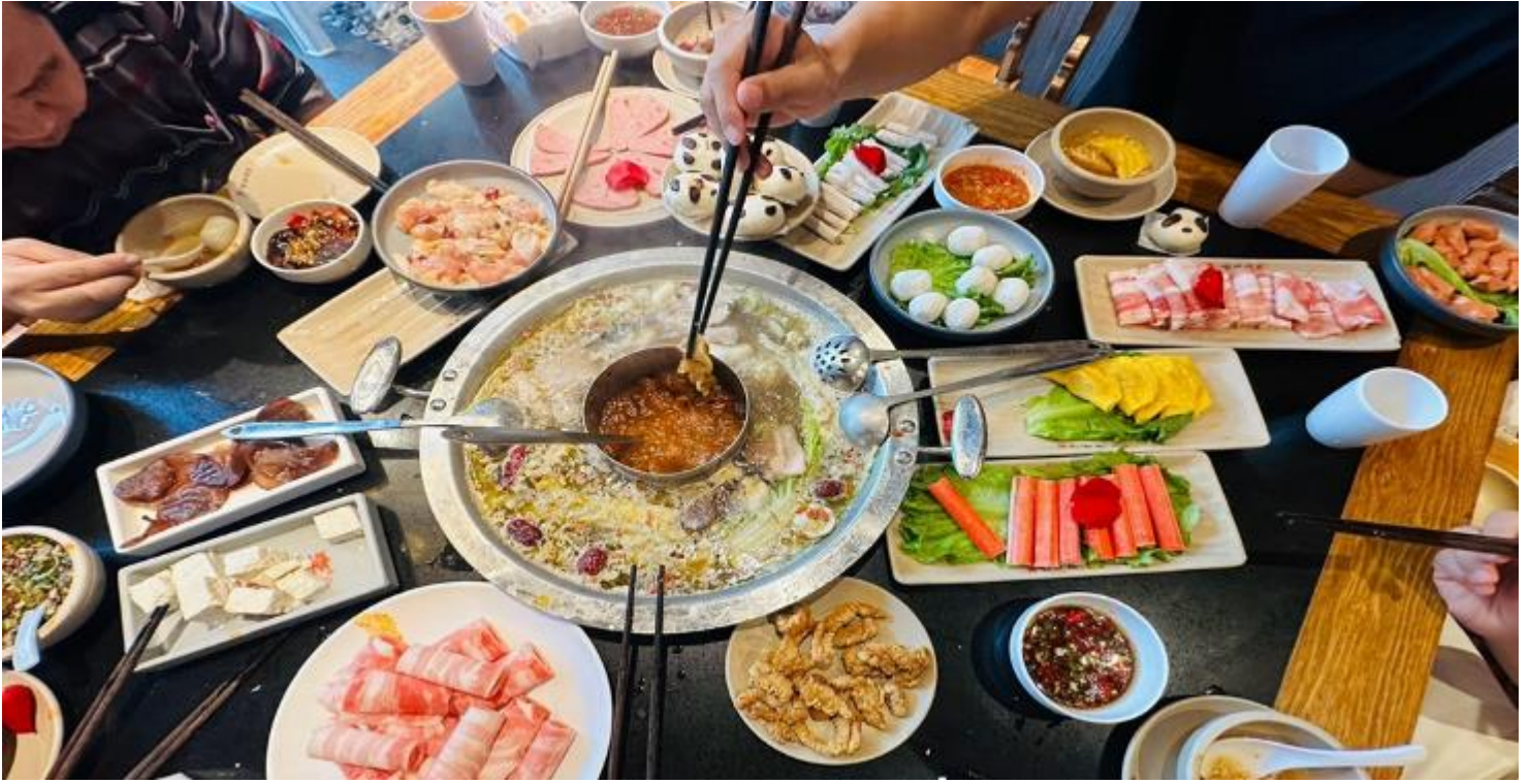
คำ รับประทานอาหารคำ ณ ภัตตาคาร (เมื่อที่ 12) *เมนูพิเศษสุกี้หมอลำเสฉวน