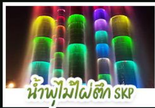
น้ำพุไม้ไผ่ตึก SKP

ภูเขาสี่ดรุณี • อุทยานหวงหลง • เมืองโบราณซงพาน • ทะเลสาบเต๋อซี อุทยานจิวจ้ายโกว • จิตรกรรมฝาผนัง • รูปปั้นหมีแพนด้าเซลฟี่ ถนนโบราณซงกวางซงแคบ • ถนนคนเดินไถ่กู่หลี่ • ถนนคนเดินซุมซี แพนด้ายักษ์ป็นตึก ณ ตึก IFS • วัดต้าจื่อ • น้ำพุไม้ไผ่ตึก SKP