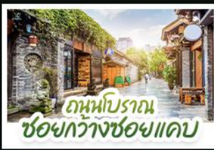
ถนนโบราณ ซงกวางซงแคบ