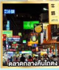
ตลาดกลางคืนโตง