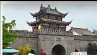
เมืองโบราณกวนเซี่ยน

ภูเขาสี่ดรุณี - อุทยานπί้นผิงโกว - สะพานหนานเฉียว - ร้านหนังสือจงซูเก๋ - เมืองโบราณกวนเสียน จตุรัสหย่าเทียนหวู่ - หิมะแพนด้าเซลฟี - ถนนโบราณชอยกว้างชอยแพบ - ถนนคนเดินไท่กู่หลี่ ถนนคนเดินซุนซี - ถนนโบราณจิ่นหลี่ - แพนด้ายักษ์ปิงตึก - น้ำพุไม้ไผ่ตึกSKP - วัดต้าเจี๋ย