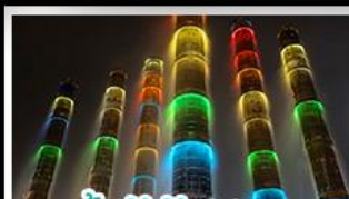
น้ำพุไม้ไผ่ตึกSKP