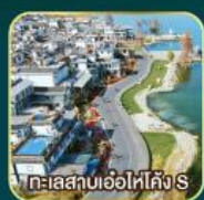
ทะเลสาบเอ๋อไห่คิง S