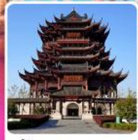
วัดหลงหยวน