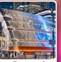
เรือหลุยส์