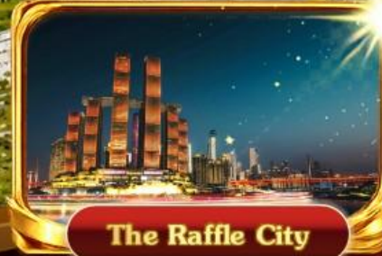
The Raffle City