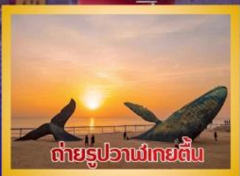
ต่ายรูปลาวาฬยักษ์

สะพานจันเจียว-โบสถ์คาทอลิกชิงเต่า (ชมภายนอก)-ป่าตึกวน-พิพิธภัณฑ์เบียร์ชิงเต่า -ถนนคนเดินไท่ตง -ผิงไห่เก๋อ-ชายหาดและจุดถ่ายรูปปลาวาฬยักษ์ -ถนนอ้าววีป่าเจียว-ชายหาดลากลอยไห่-จัตุรัสชิงฟู่หมิน-สวนเว่ยไห่ -สวนเยวี่ไห่-เกาะหยางหม่าย่าน - เมืองท่าเหยียนไถ่-ท่าเรือชาวประมงเหยียนไถ่-ภูเขาเหยียนไถ่-จัตุรัส 54 -ศูนย์โอลิมปิกเรือใบชิงเต่า-ภูเขาเหลาซาน-วัดไท่ซิงกง-สวนเลี้ยวมวยเต่าชายหาดทะเลหมายเลข 3-อาคารไฟเทียน ชั้น 81- Cyber Punk