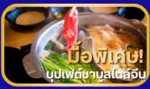
มือพิเศษ! บุปเป็ดชาบูสุโตลู้จิ้น