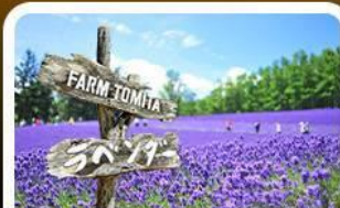
โทมิตะฟาร์ม