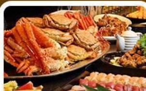
บุฟเฟต์ซาซุ+ชาปู 3 ชนิด