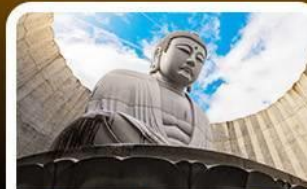
เนินเขาแห่งพระพุทธรเจ้า