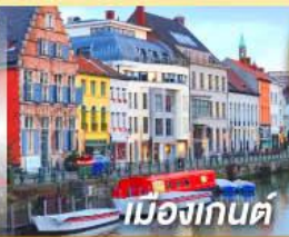
เมืองกันต์