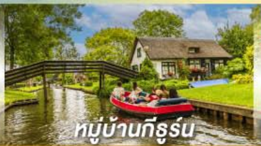
หมู่บ้านทีรูร์น