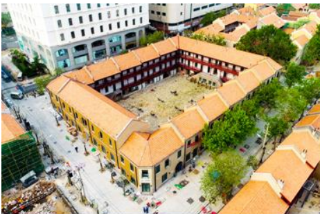
เมืองเก่าเยอรมัน ตรอกกว่างซิงหลี่