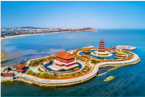
อุทยานท่องเที่ยวแปดเซียนข้ามทะเล