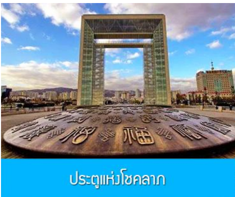
ประตูแห่งโชคกลาง