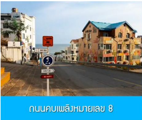
ถนนคอบเพลิงหมายเลข 8

นำท่านชมสวนสาธารณะเวย์ไห่ 威海公园 สวนสาธารณะริมทะเลที่ใหญ่ที่สุดของเมืองเวย์ไห่ ให้ท่านชมและถ่ายภาพคู่กับ กรอบรูปยักษ์วิวทะเล 威海公园大相框 แลนด์มาร์คที่เป็นอีกหนึ่งไฮไลท์ที่ฮิตของเมืองเวย์ไห่