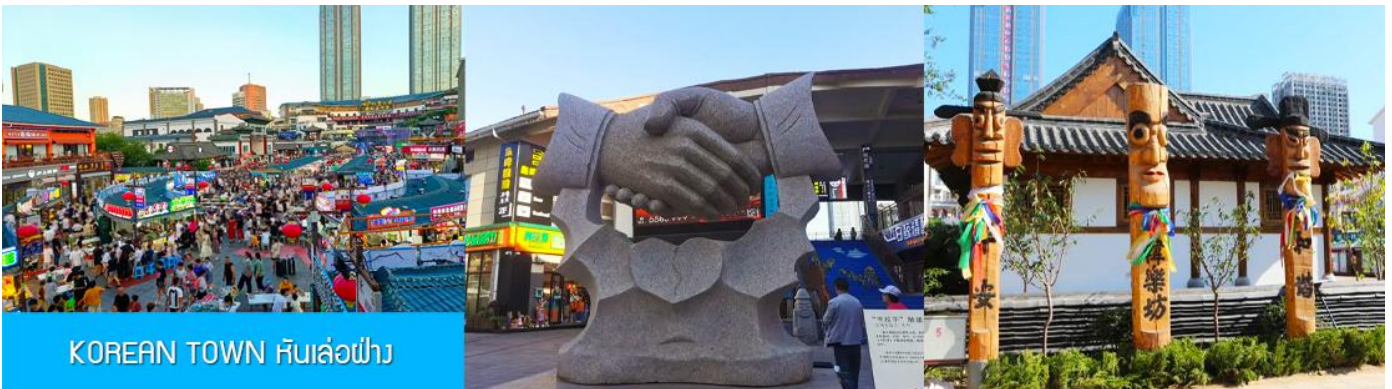
KOREAN TOWN หันเล่อฝาง