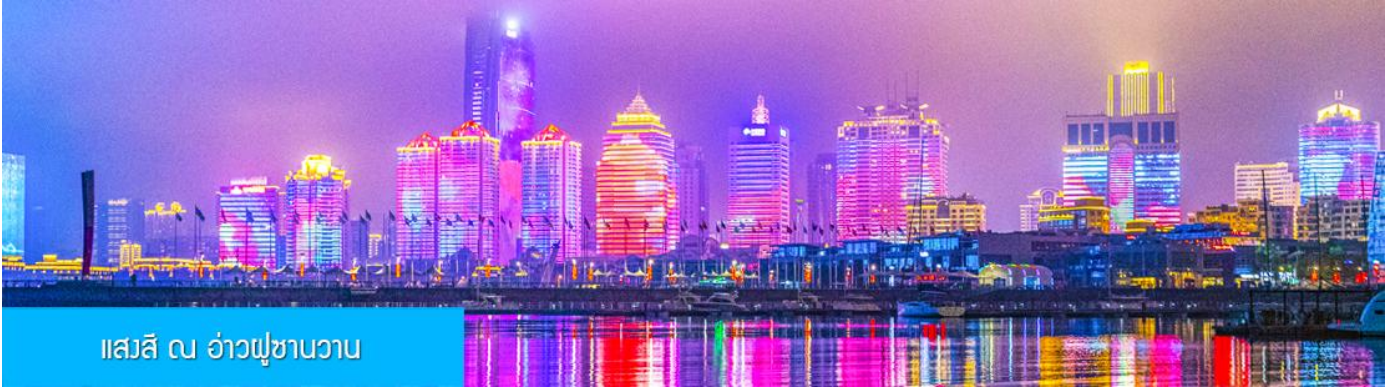
แสงสี ณ อ่าวฟูซานวาน

หลังอาหารนำท่านชมความอลังการของแสงสี ณ อ่าวฟูซานวาน 浮山湾灯光秀 ชมความอลังการของแสงสียามหัวค่ำ และไฟที่เต้นระบำได้บนตึกสูง และเป็นหนึ่งในไนท์วิวที่สวยงามที่สุดแห่งหนึ่งของจีน..... พักที่ JIFENG HOTEL / KAILAIZHIHUI HOTEL โรงแรมระดับ 4 ดาวท้องถิ่น เมืองชิงเต่า