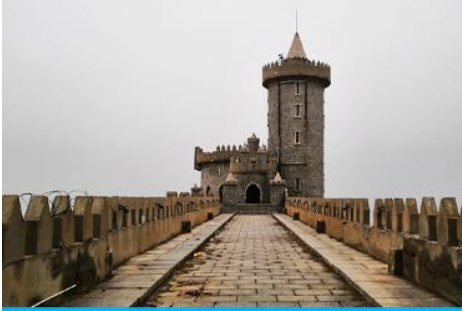
คาเฟ่อีสตว