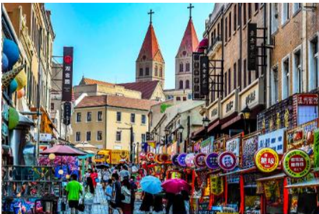
ถนนางซาน