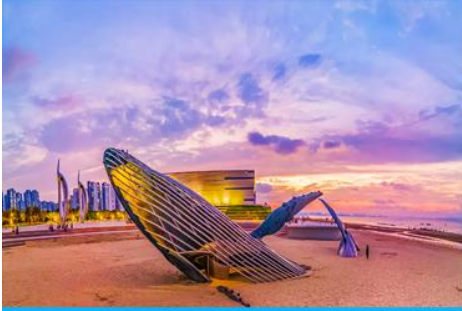
ประติมากรรม วาฬโด้เดี่ยว