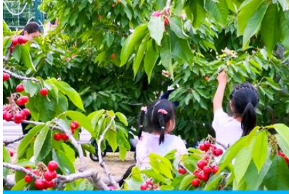
สวนเชอร์รี่