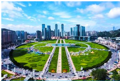
จัตุรัสชิงไห่

หลังอาหารนำท่านสู่ สวนเชอร์รี่ 樱桃园现摘樱桃 ให้ท่านสัมผัสประสบการณ์สุดชิล ด้วยการเด็ดเชอร์รี่สดจากต้นภายในสวนเชอร์รี่ (เชอร์รี่จะของเมืองนี้จะเริ่มสุกและเก็บได้ในช่วงปลายเดือนพฤษภาคม - มิถุนายนของทุกปี ในกรณีที่ผลเชอร์รี่น้อยหรือหมดเร็วกว่าปกติ ทางทัวร์ขอสงวนสิทธิ์ในการจัดโปรแกรมอื่นแทนการเด็ดเชอร์รี่)