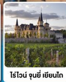
ไร่ไวน์ จุนยี่ เยียนไก